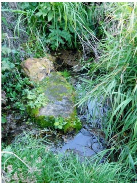
Рис. 7 Родник № 3, сентябрь 2018 г.

Исследования 2019 г. Родник заметно обмелел. Максимальная глубина 20 см сохранилась, но к краям она уменьшилась до 5 см. Ширина в 2018 году была 1м 20 см, а на момент исследований 2019 г. она составила всего 90 см. А вот длина уменьшилась незначительно. И если в 2018 г. она составляла 2м 10 см, то в 2019 – чуть меньше 2-х метров. Однако, хорошо стали видны выходы воды на поверхность. Она медленно вытекает из трещиноватых известняков в западной части родника и здесь же едва заметны выходы воды в виде небольших фонтанчиков со дна. Площадь поверхности камней, покрытая перифитомом, так же заметно сократилась, но перифитон в основном ярко зелёный. Стала шире водоотводная канавка, она стала более ровной, ширина в среднем – 90 см, длина прежняя, немного больше 4-х метров.