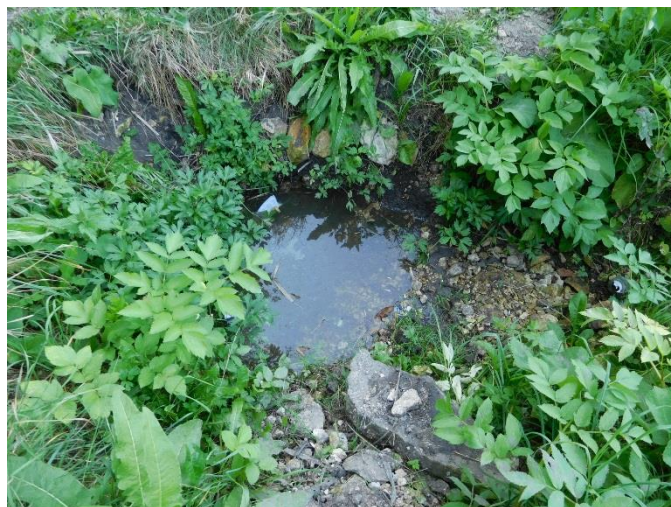
Рис. 11 Родник № 4 (Георгиевский), август 2019 г.