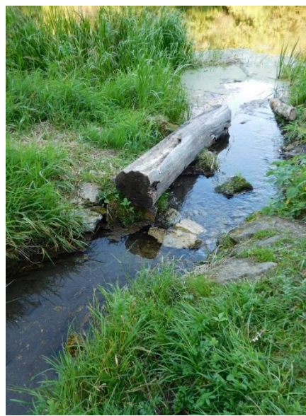
Рис. 8а Водоотводная канавка, август 2019 г.