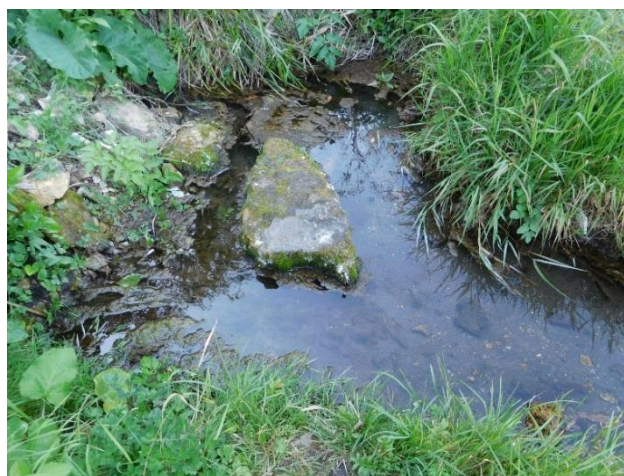
Рис. 7а Родник № 3, август 2019 г.