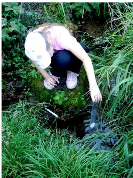
Рис 9 Во время полевых работ (2018 г.)