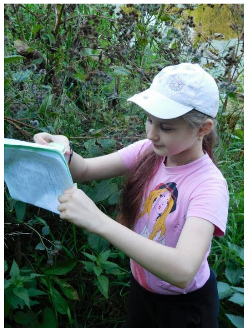
Рис. 17, 18 На полевых работах (родник 5)

На окружающую местность родники не оказывает отрицательного влияния, так как находятся близко к руслу, и избытки воды сразу же стекают в реку. А вот река влияет на родники пагубно. После половодья они затягиваются илом и донными отложениями, еле-еле пробиваясь на поверхность. Поэтому родникам нужна наша помощь.