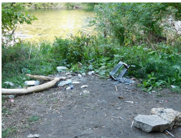
Рис 13, 14 Следы пребывания отдыхающих у Георгиевского родника