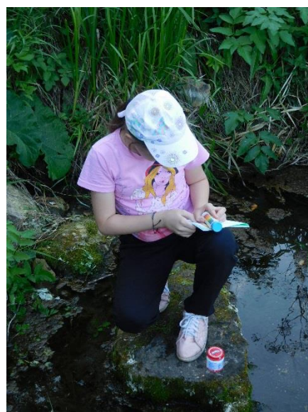
Рис 10 Во время полевых работ (2019 г.)