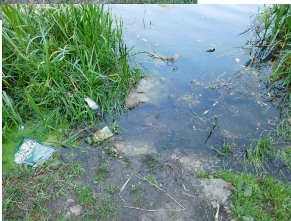
Рис. 15 Дон в районе Георгиевского родника.