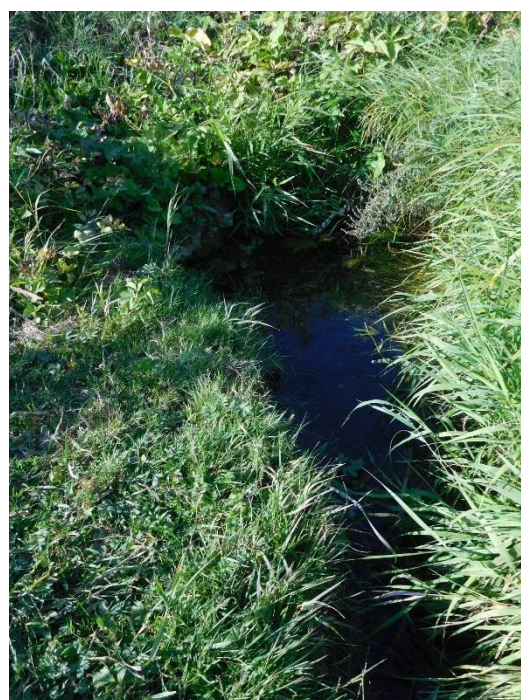
Рис. 4 а Родник № 2, август 2019 г.