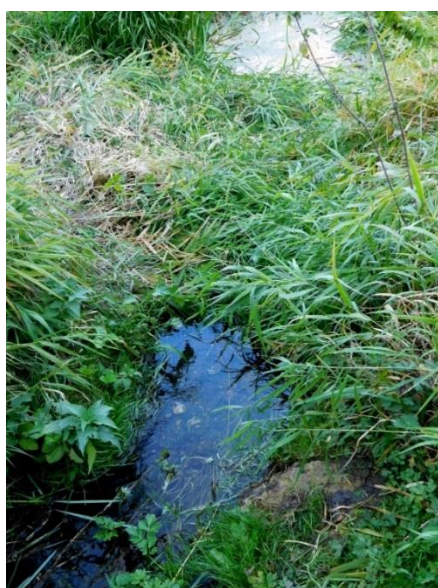
Рис. 8 Водоотводная канавка, сентябрь 2018 г.