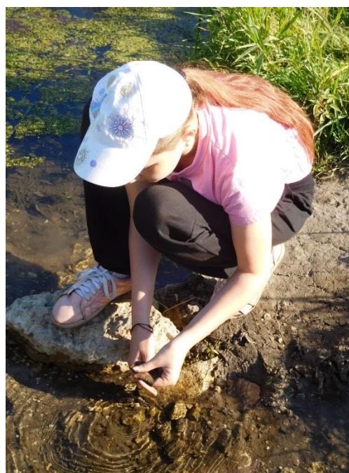
Рис 3 Во время полевых работ (2019 г.)