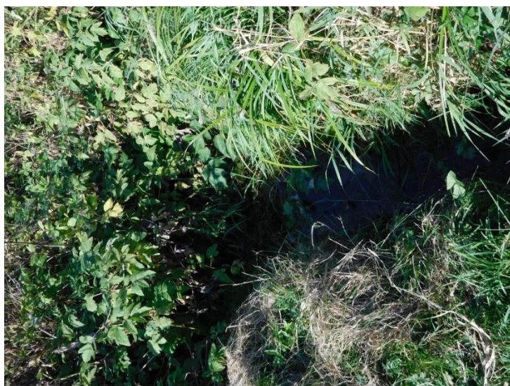
Рис. 4 Родник № 2, сентябрь 2018 г.