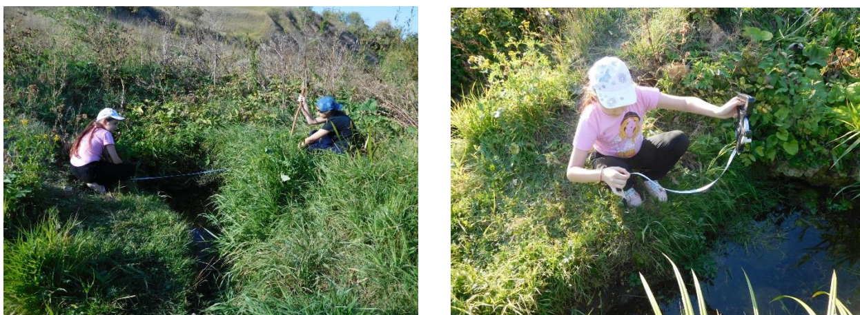
Рис. 5, 6 На полевых работах (2019 г.)

Исследования 2019 г. Родник № 2 стабилен. Изменился состав донных отложений. На время исследований 2019 г. преобладали песчано-илистые отложения. Заметно осветлилась родниковая вода, улучшился сток воды в реку. Немного увеличились ширина и длина родника.