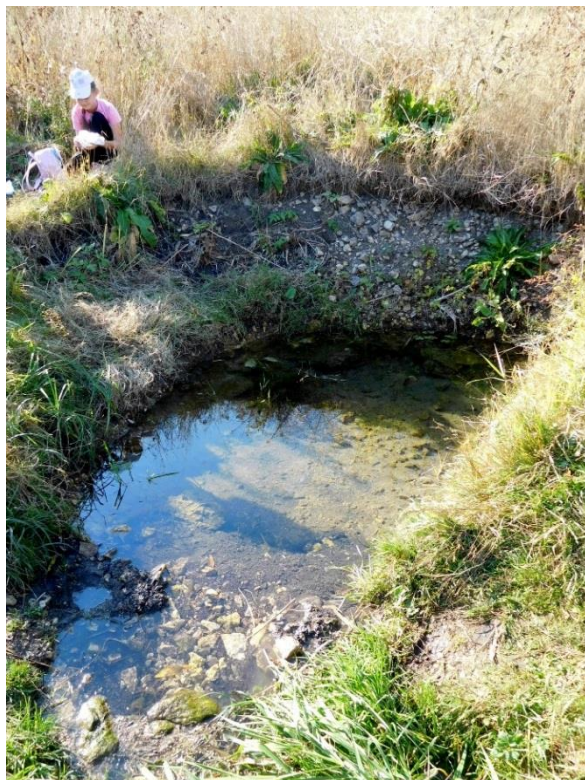
Рис. 1 Родник № 1, сентябрь 2018 г.

Родник № 1 располагается в северной части города в пойме Дона в правобережной части под скальной кручей немного южнее пляжа с травяным покрытием. Это самый большой родник из исследуемых.