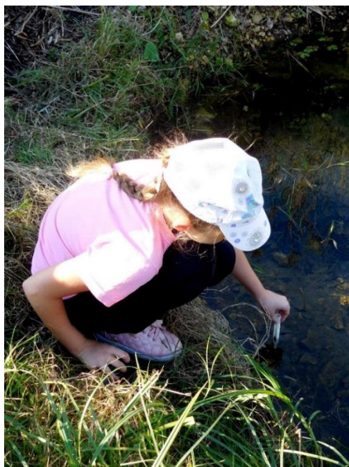
Рис 2 Во время полевых работ (2018 г.)