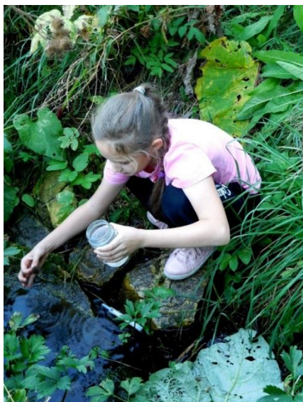
Рис 12 Во время полевых работ на Георгиевском роднике

Территория Георгиевского родника и родника № 3 используется горожанами для отдыха, поэтому здесь всегда есть выгоревшие плешины от кострищ и повсюду разбросаны остатки бытового мусора. Всё это после половодья и сильных дождей сносится в реку, в результате чего и река Дон в названном месте сильно загрязнена бытовым мусором.