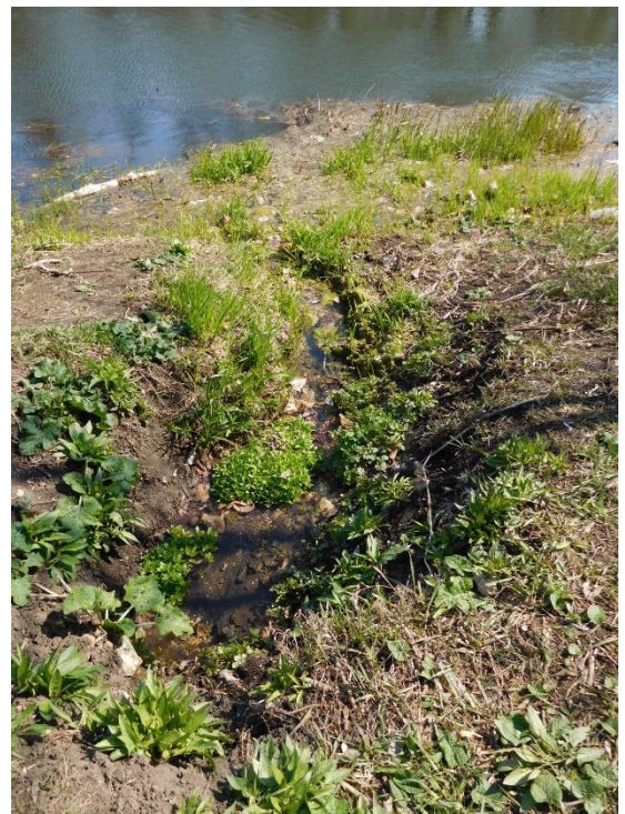
Рис. 16а Родник № 5, май 2019 г.