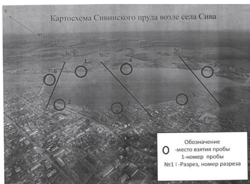
Рис. 1. Картохеса Сивинского пруд возле с.Сива

Период исследования с 02-23 июля 2018 года и с 03-25 июня 2019 года. Всего взято 7 проб в прибрежной зоне в трёх разрезах: 1 разрез – в верховье пруда, 2 разрез – в срединной части и третий – в приплотинной части пруда. Общая покатость р. Сива – с северо-востока на юго-запад, в основном течет по лесной местности, залесённость составляет 71,7 %.