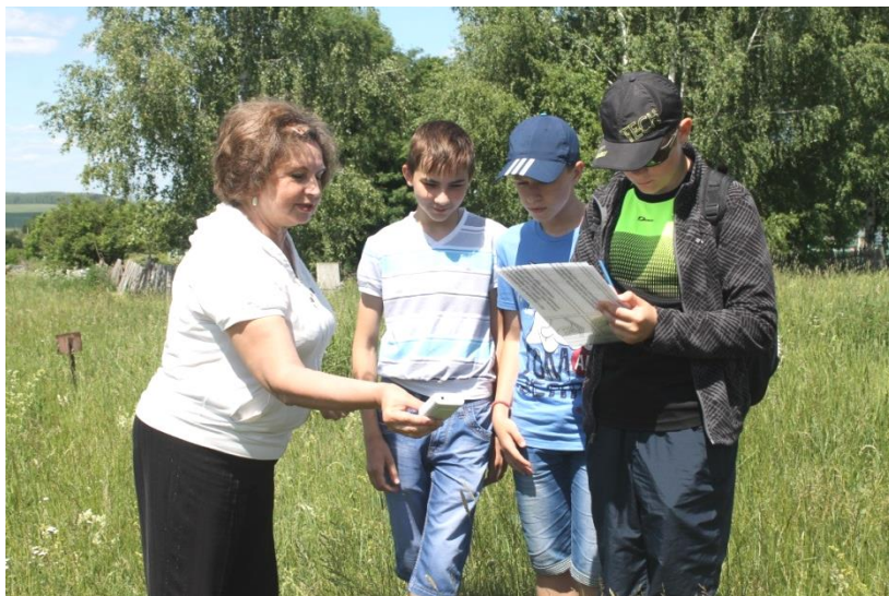
Фото 6. Измерение гамма-фона на лужайке возле Георгиевского храма