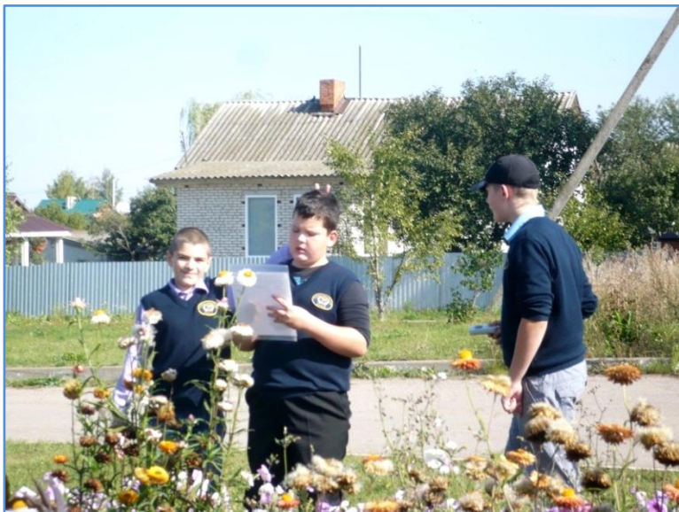
Фото 5. Дозиметрическое обследование ул. Козаченко в с. Пришня