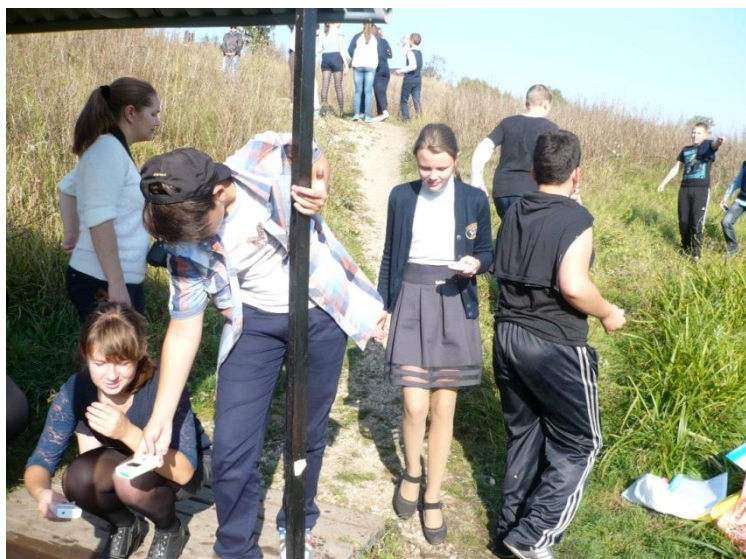
Фото 9. Замеры гамма-фона на роднике в д. Захаровке