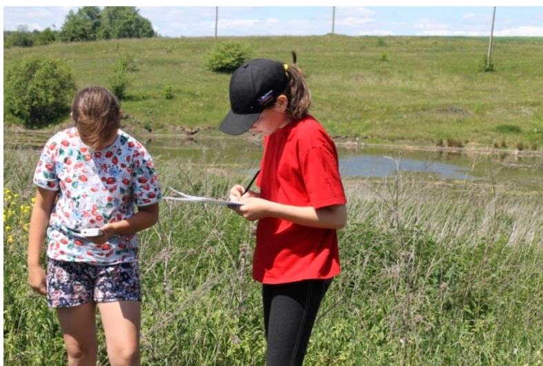
Фото 10. Дозиметрический контроль гамма-фона в пойме р. Сукромени в д. Бегичево