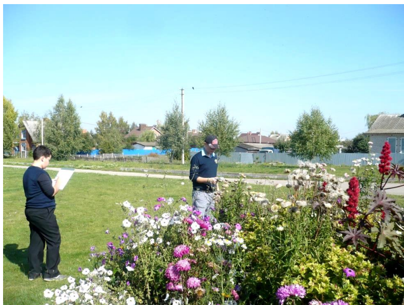
Фото 7. Измерение МЭД гамма-излучения на ул. Пенькова в с. Пришня