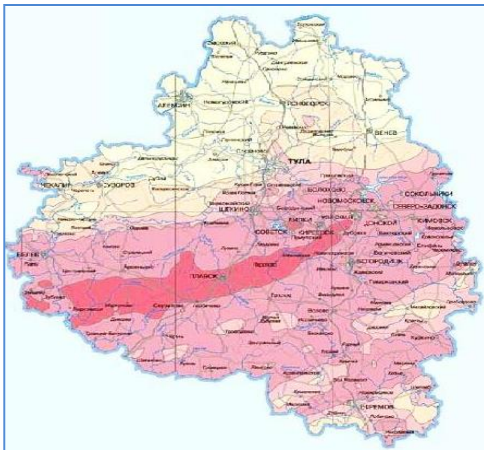
Рис. 1. Карта загрязнения цезием-137 территории Тульской области вследствие аварии на Чернобыльской АЭС (1986 год)

На основании указанных данных распоряжением правительства РСФСР от 28.12.91 г. № 237-р был утвержден «Перечень населенных пунктов, относящихся к территориям радиоактивного загрязнения Российской Федерации», определены границы зон радиоактивного загрязнения. Первоначально к радиоактивно загрязненным территориям были отнесены 2036 населенных пунктов Тульской области, из них к зоне проживания с правом на отселение – 308 населенных пунктов, а к зоне проживания с льготным социально-экономическим статусом – 1728 населенных пунктов [25].