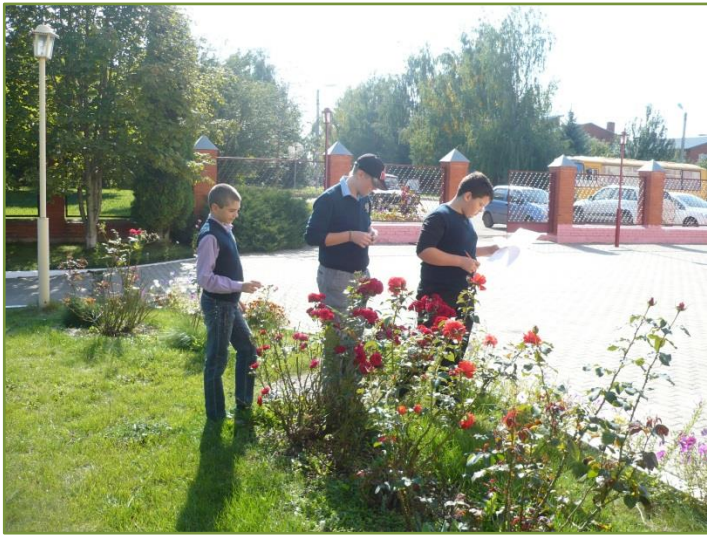
Фото 1. Замеры гамма-фона на цветочных газонах