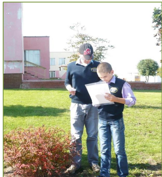
Фото 2 – 3. Дозиметрический контроль древесно-кустарниковых насаждений