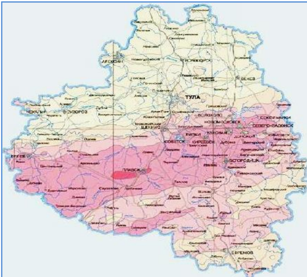
Рис. 2. Карта прогнозного загрязнения цезием-137 территории Тульской области вследствие аварии на ЧАЭС (2016 год)

По прогнозным данным Росгидромета [4, 5, 6], снижение радиоактивного загрязнения территории Тульской области до уровня менее 5,0 \text{ Ки/км}^2 ожидается лишь к 2029 году, а снижение до уровня ниже 1 \text{ Ки/км}^2 – не ранее 2098 года (см. карту на вкладке). Все эти годы население, естественно, будет нуждаться в мерах социальной поддержки, должны проводиться мероприятия по реализации целевых программ, направленные на дальнейшую реабилитацию загрязненных территорий и оздоровление проживающего на них населения.