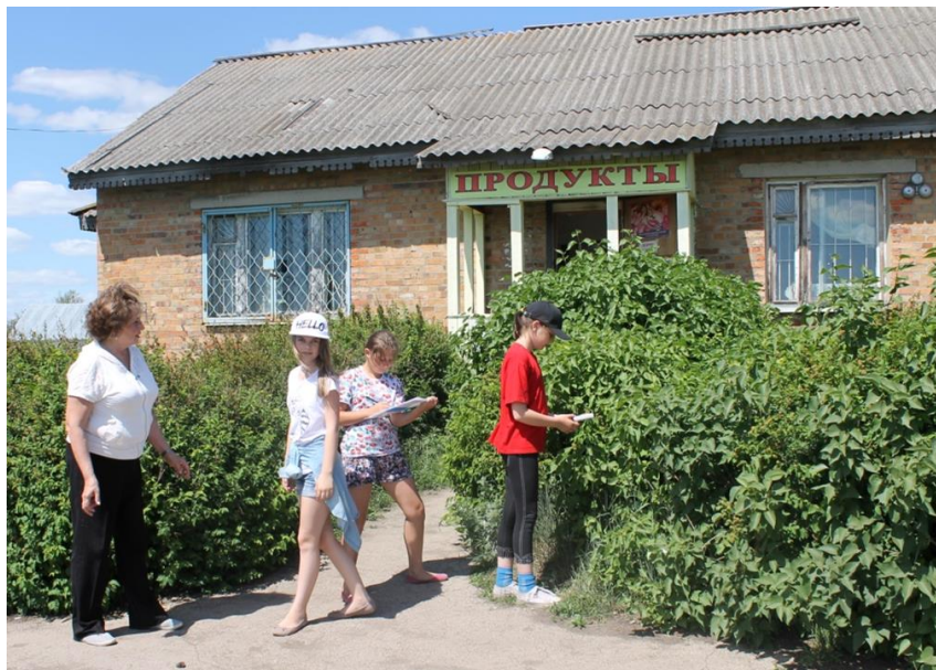
Фото 8. Замеры гамма-фона в д. Захаровке