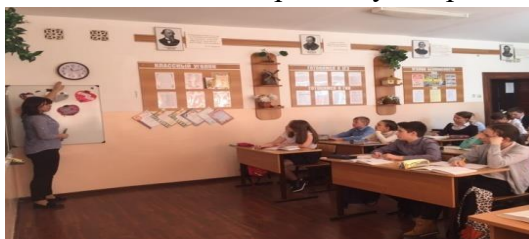
Рисунок 7 - Фото к эксперименту «Задание по тексту»