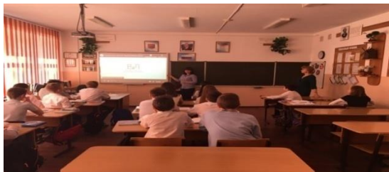
Рисунок 10 - Фото «Вторая встреча с 5 классом»