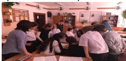
Рисунок 2 - Фото к викторине 5 класс