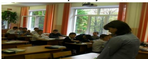
Рисунок 6 - Фото к эксперименту «Стрелка»