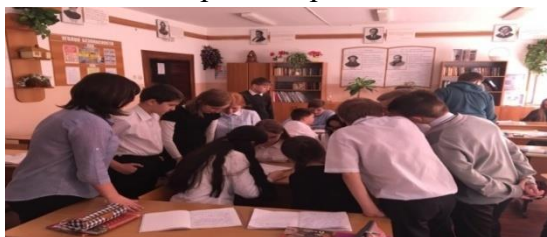
Рисунок 12 - Фото «Вторая встреча с 6 классом»