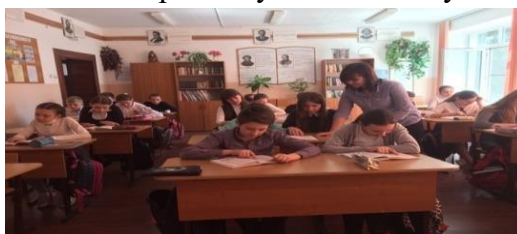
Рисунок 5 - Фото к эксперименту «Найди слово»