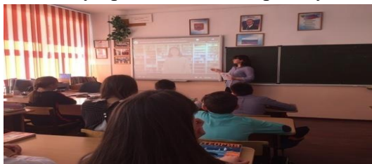
Рисунок 8 - Фото «первая встреча с 5 классом»