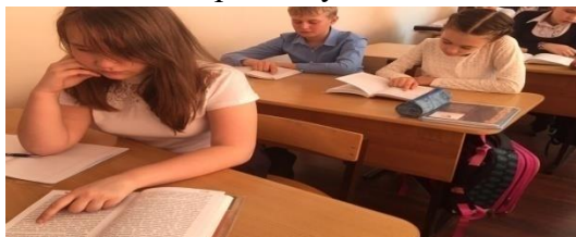
Рисунок 8 – Фото к показу презентации по проекту школьная летопись 5 класс