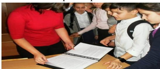
Рисунок 11 - Фото «Первая встреча с 6 классом»