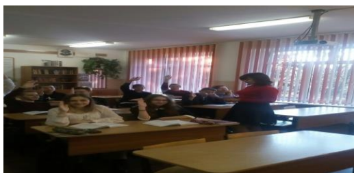
Рисунок 4 - Фото к эксперименту «Чтение вслух всем классом»