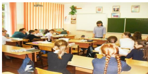
Рисунок 3 – фото к викторине 9 класс