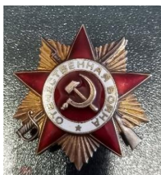
Орден Отечественной Войны