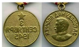
Медаль «За Победу над Японией»