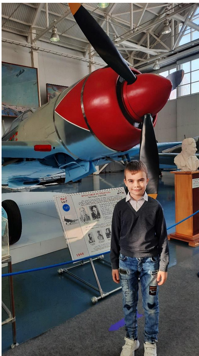
(Фронтовой истребитель Кожедуба Ла-7)

Именем Кожедуба названы улицы в Москве и других городах России и Украины. Его имя носит 237-й гвардейский центр показа авиационной техники имени ВВС России. На родине Героя в Ображеевке был установлен его бюст, действовал музей. Другой бюст находится в Центральном музее Великой Отечественной войны 1941 – 1945 гг. в Москве. Мемориальная доска И.Н. Кожедубу установлена на доме в Сивцевом Вражке в Москве, где он жил в последние годы. Его самолет Ла-7 экспонируется в Центральном музее ВВС в Монино.