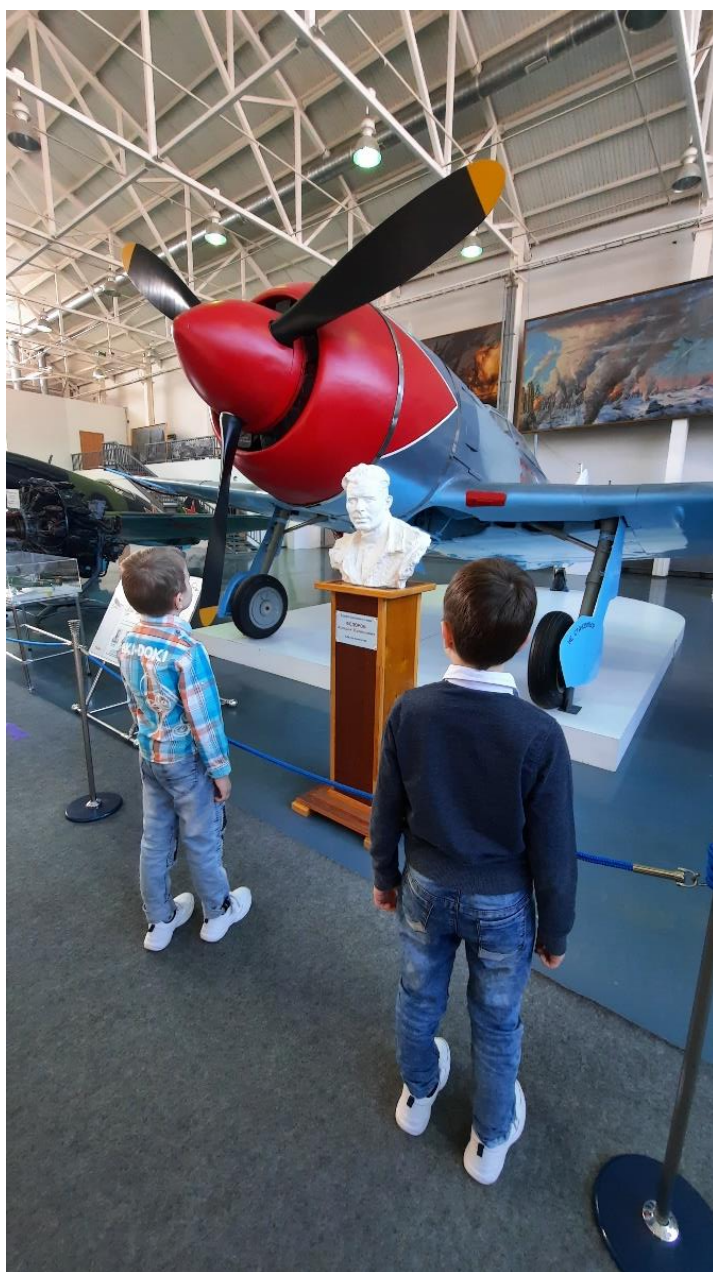
(Фронтальной истребитель Кожедуба Ла-7)

Второе и третье звания Героя Советского Союза Кожедуб Иван Никитович получил 19 августа 1944 года и 18 августа 1945 года.