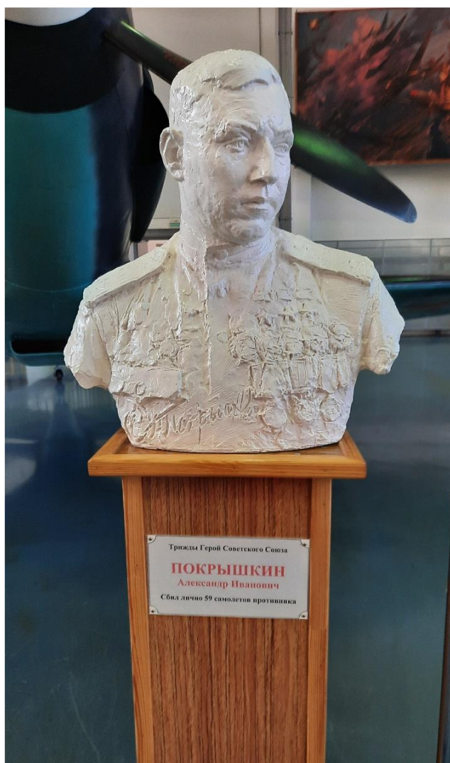
(Бюст Покрышкину А.И. в Центральном музее Военно-Воздушных сил в г. Монино )

В армии – с июня 1932 года. Далее он поступает в Качинскую военную авиационную школу летчиков. Менее, чем за один год оканчивает знаменитую Качу и получает назначение в 55-й истребительный авиаполк, располагавшийся на западной границе, под Бельцами (Молдавия). Там и застало А.И. Покрышкина начало Великой Отечественной войны.