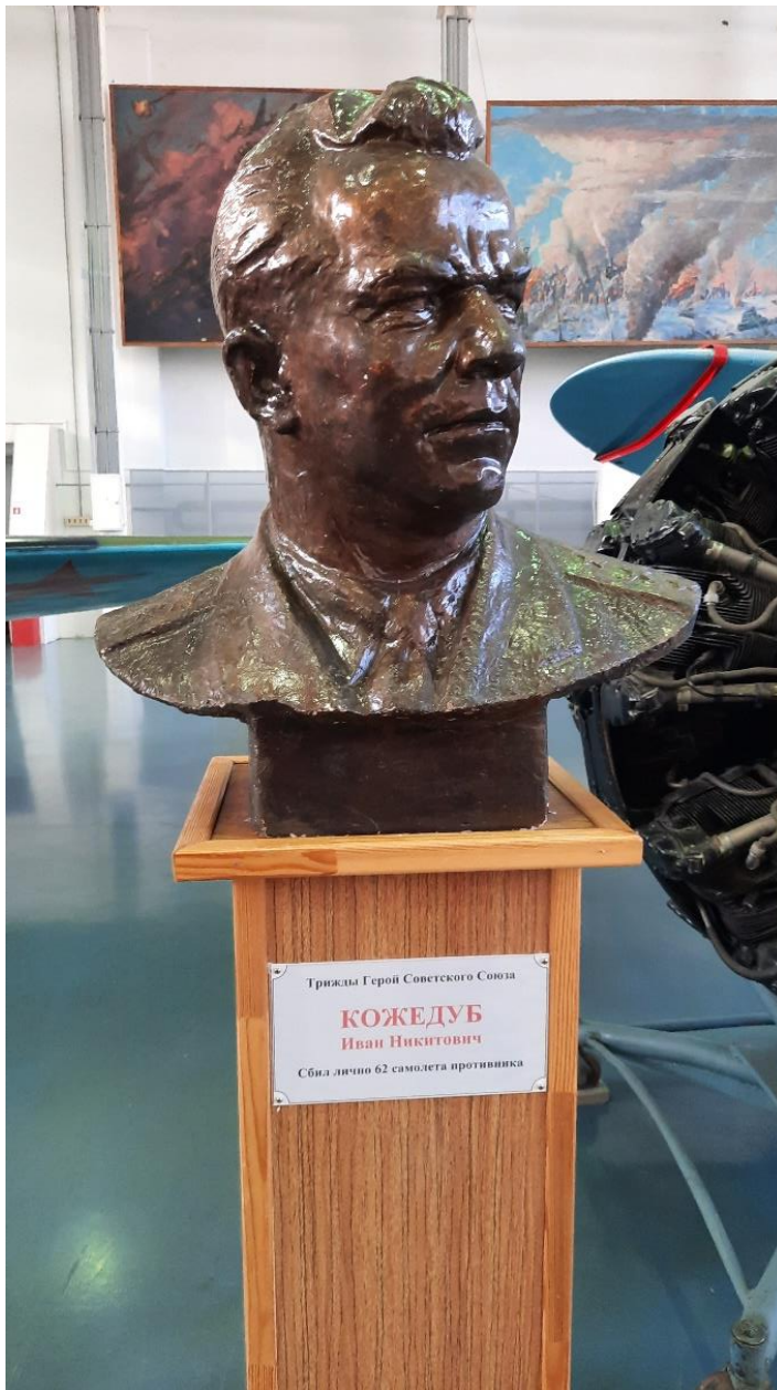
(Бюст Кожедубу И.Н. в Центральном музее Военно-Воздушных сил в г. Монино)

За образцовое выполнение боевых заданий Командования на фронте борьбы с германским фашизмом и проявленные при этом отвагу и героизм Указом Президиума Верховного Совета СССР от 4 февраля 1944 года старшему лейтенанту Кожедубу Ивану Никитовичу было присвоено звание Героя Советского Союза с вручением ордена Ленина и медали «Золотая Звезда».