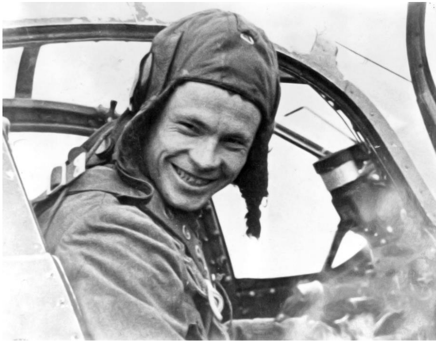
(Майор П.С. Кутахов в кабине истребителя Р-39 «Аэрокобре», Карельский фронт, 1944 год)

27 марта 1943 года был сбит в воздушном бою, спасся на парашюте. С апреля 1943 года - помощник командира полка по воздушно-стрелковой службе. Указом Президиума Верховного Совета СССР от 1 мая 1943 года удостоен звания Героя Советского Союза с вручением ордена Ленина и медали "Золотая Звезда".