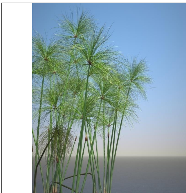
Рис. 1. Тростник