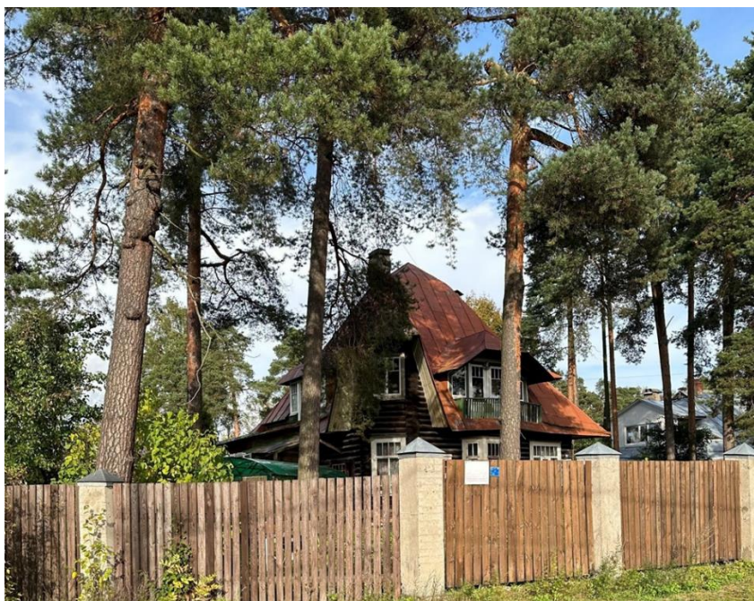
Лесная улица дом 23