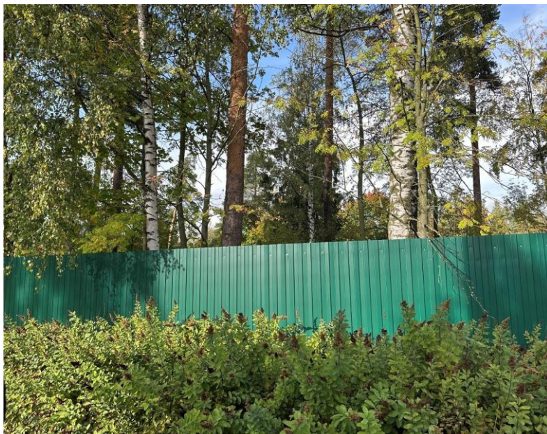
Полевая улица дом 5

руководством построено много домов на Петроградской стороне. Дом прекрасно сохранился, его нынешние владельцы очень хорошо за ним ухаживают. Когда в доме производили ремонт, то на втором этаже под обоями был найден адрес и телефон городской квартиры Гингера, он записал эти данные для строителей, чтобы с ним могли связаться в случае необходимости.