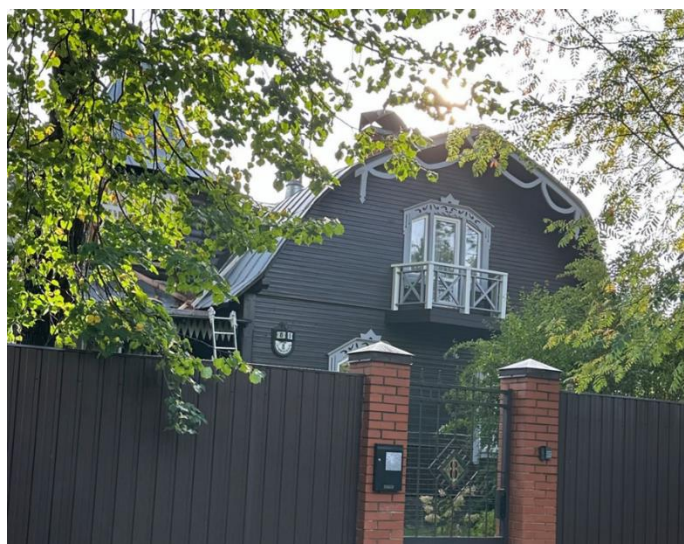
Улица Коммунаров дом 8

Этот адрес в 1920-1923 гг был поставлен на учет как место Лахтинской неолитической стоянки. Играя в песок дети нашли топор, несколько наконечников от стрел. Далее были организованы раскопки и была найдена керамика, посуда и еще некоторые орудия труда. Стоянка существовала не долго, потому что уровень Древне Балтийского моря постоянно менялся.