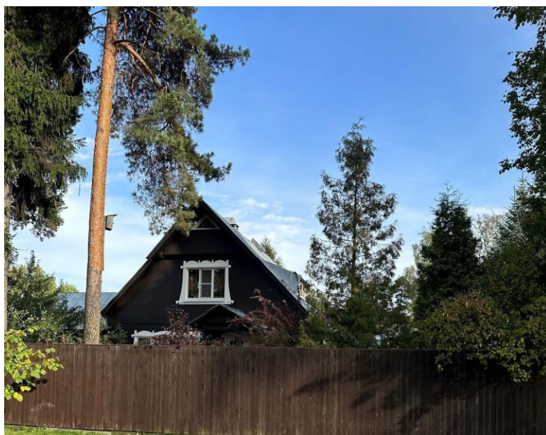
Полевая улица дом 15

Одним из первых построил дом в Ольгино на Вокзальной улице дом 11 художник Иван Евстигнеевич Никифоров. Дом выполнен в сдержанном стиле с тонко прорисованными деталями, сразу обращает на себя внимание.