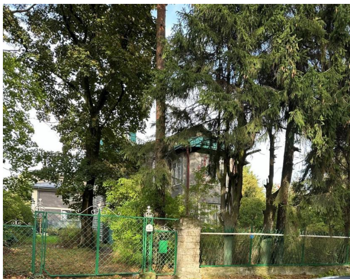
Вокзальная улица дом 11

Первое письменное упоминание о Лахте было в 1500 году, поэтому эту дату принято считать годом основания Лахты. Ольгино основано в 1907 году и буквально за 10 лет поселок был застроен. Ольгино построено по принципу город-сада. Я живу в Ольгино с рождения, на Полевой улице. Вокруг нашего дома очень много интересных мест. В Лахте и Ольгино, жило много архитекторов, они строили дома для себя и для сдачи в аренду дачникам.