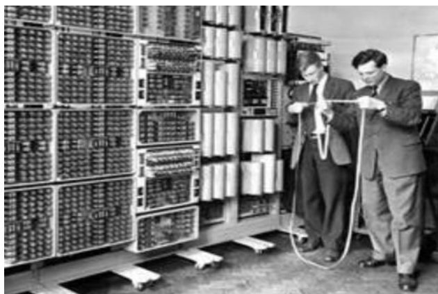
Рис. 3. Дешифровальная "Машина Тьюринга"[1]

Работу, выпущенную Аланом Тьюрингом, и посвященную дешифровке "Энигмы", его коллеги называли "Книгой Профи".[1]