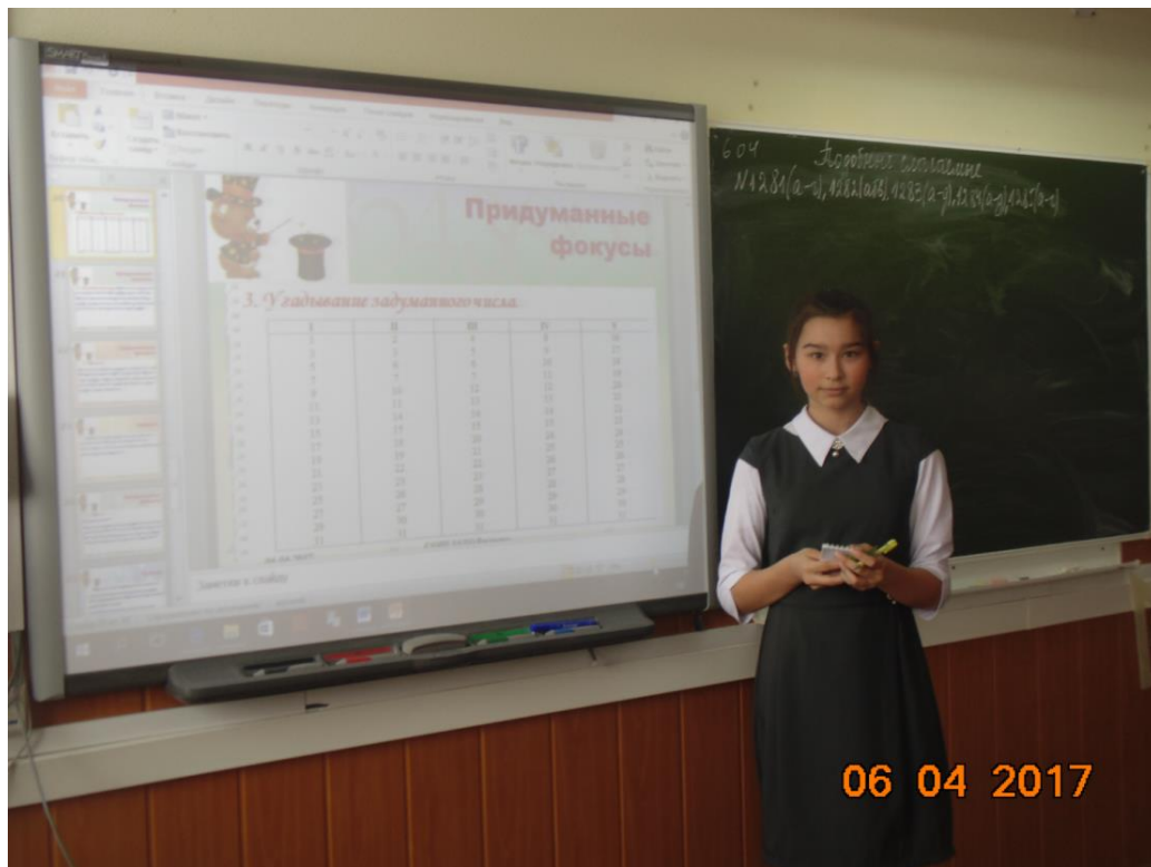
Фото 1. Отгадывание числа из таблицы.