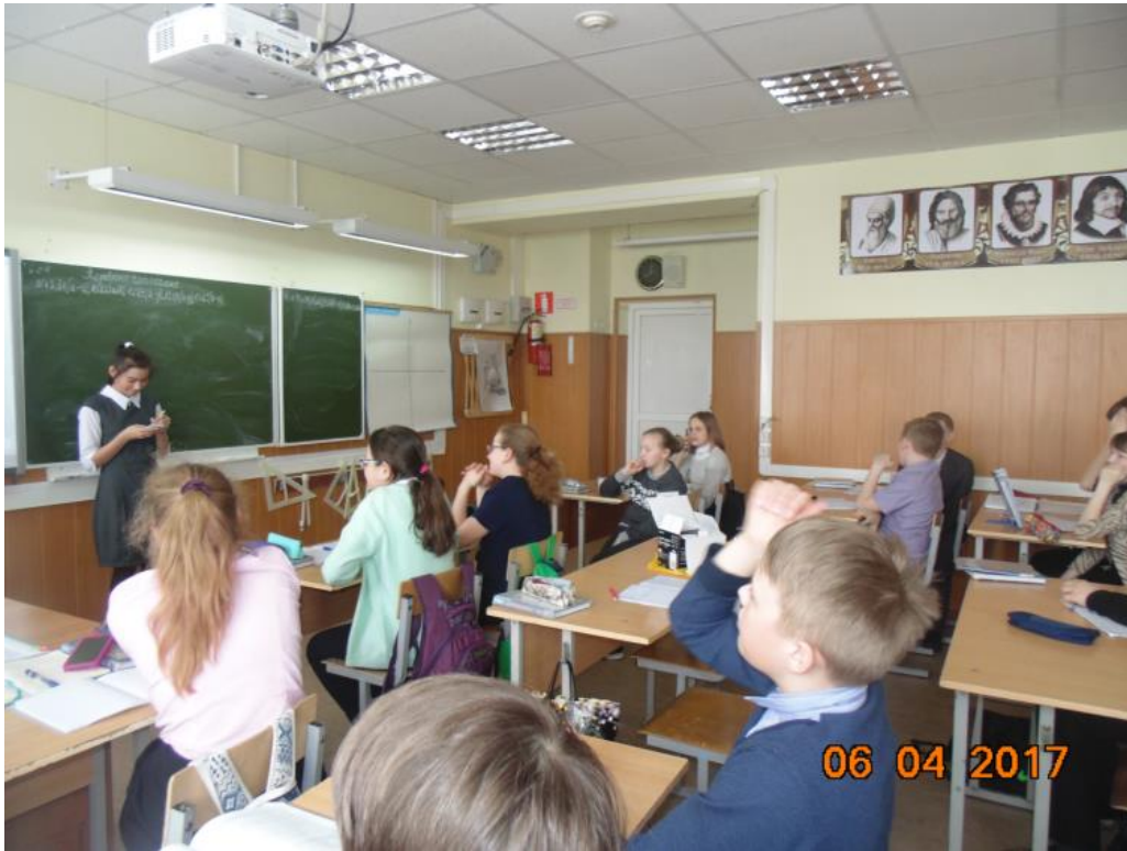
Фото 2. Демонстрация фокусов.