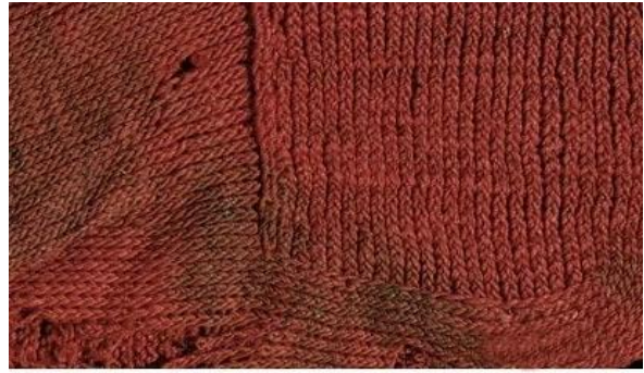
Египет. Фрагмент носка. IV-VI вв. н.э.