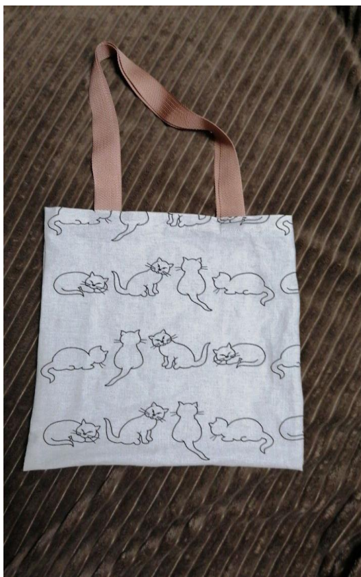
Шаблон и готовое изделие «сумка-шоппер»