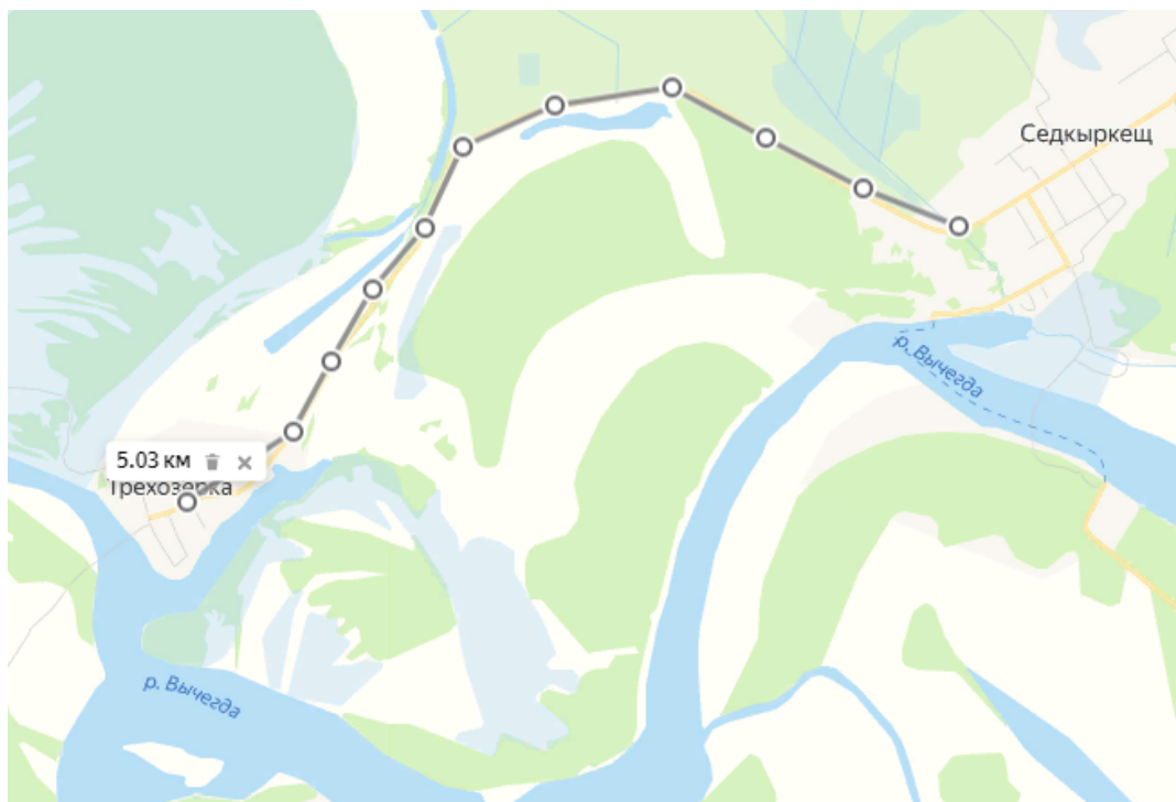
Рисунок 1.- Карта маршрута «Школьный»

Основные точки маршрута: Поселок Седкыркеш - Дорога Седкыркеш – Трехозерка - Поселок Трехозерка