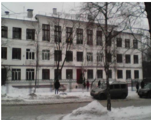
1. Больница Скорой медицинской помощи