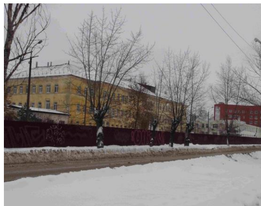
2. МБОУ школа 26