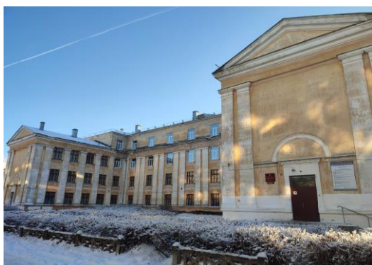
3. Дзержинский техникум бизнеса и технологий