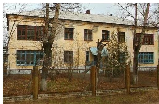
6. МБОУ №37