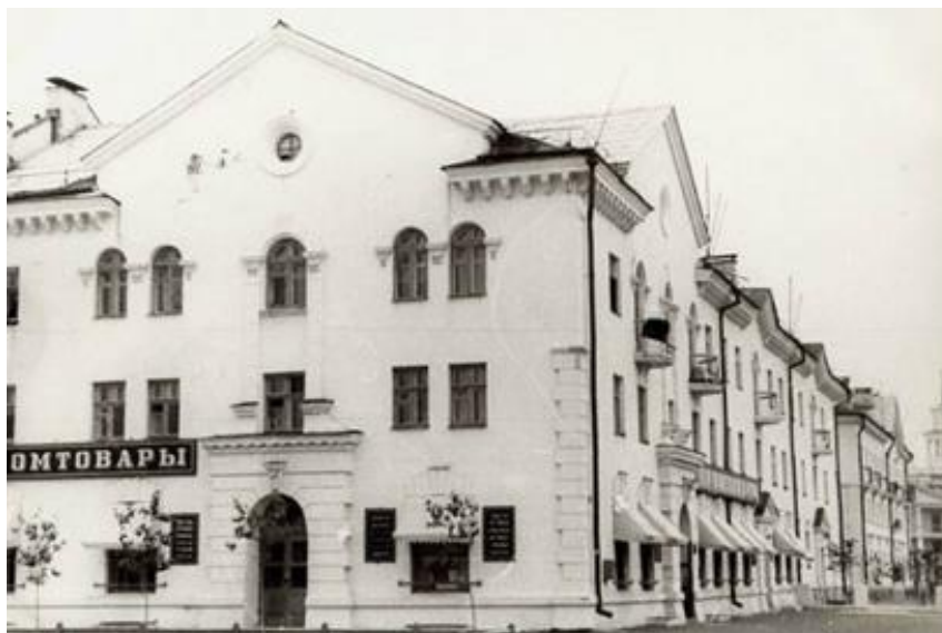
Фотография моего дома, 60-годы XX века