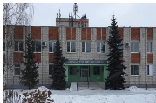
4. Дзержинский онкологический диспансер