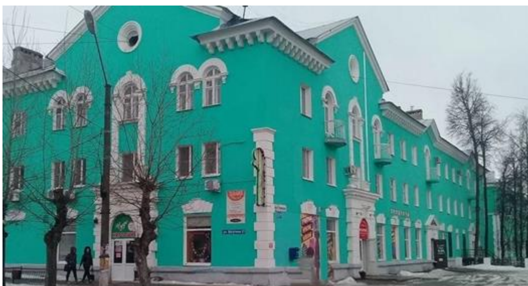
Фотография моего дома, 2022г.