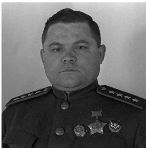
Николай Фёдорович Ватутин, советский военачальник, генерал армии