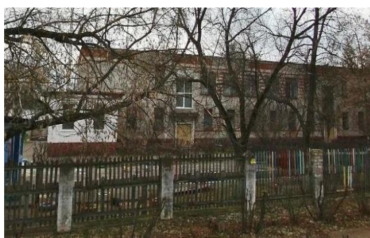
5. МБОУ №103