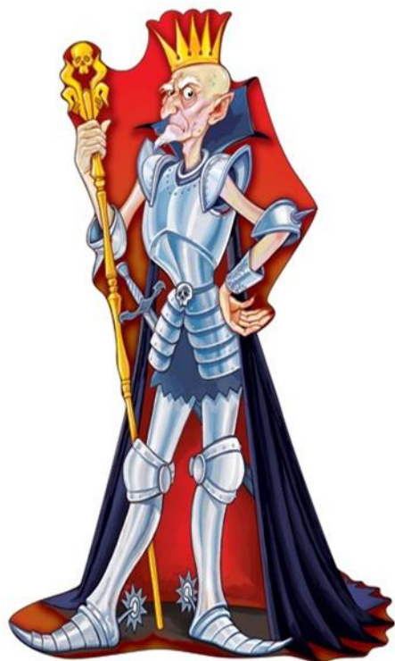
Сказочный Кощей Бессмертный