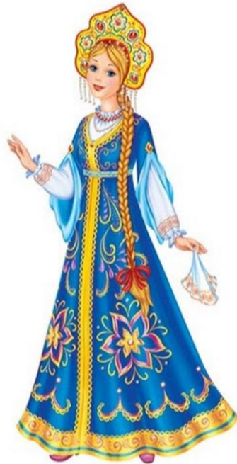
Сказочная Василиса Премудрая