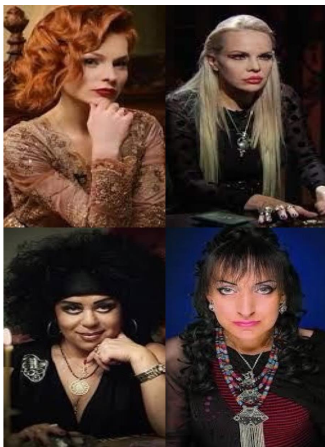
Современная Баба Яга.