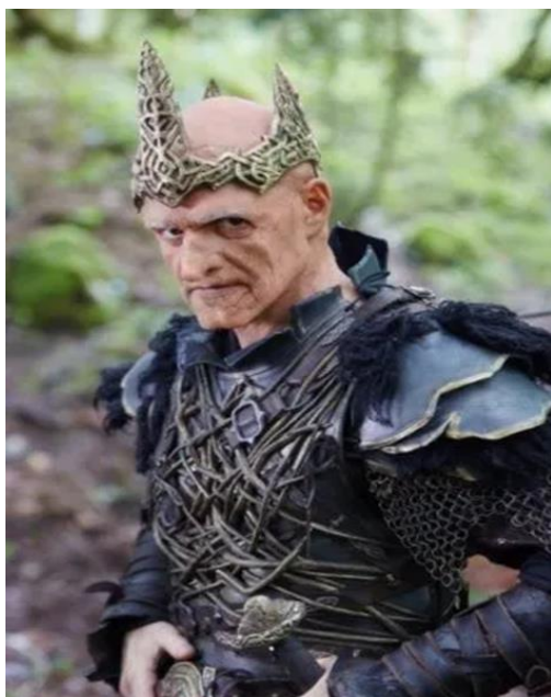
Современный Кощей Бессмертный, сказка «Последний богатырь» .