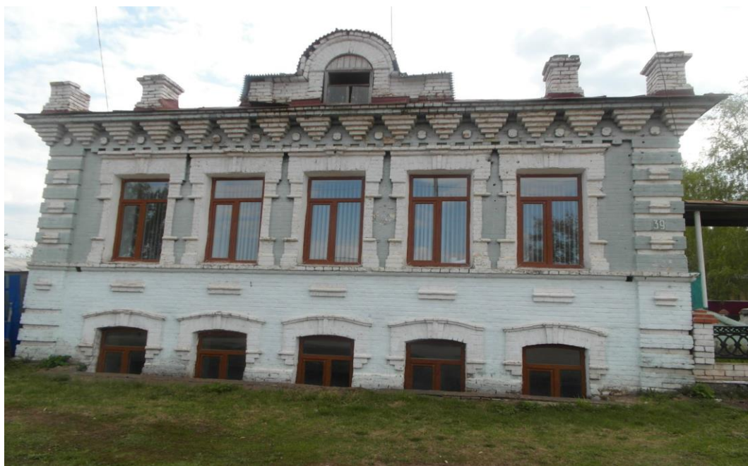
Дом купца Тихонова