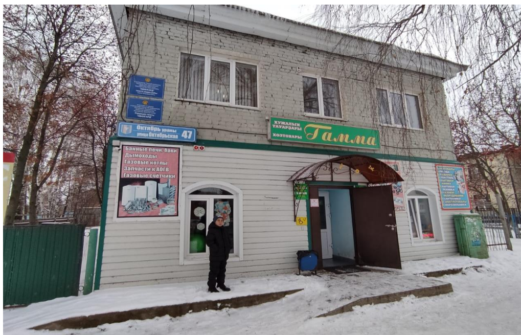
Дом купца Ф.Я.Маркова