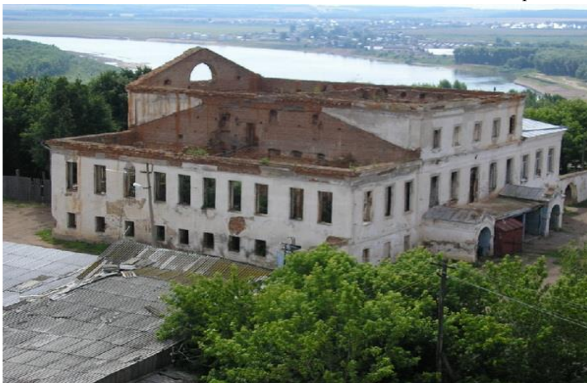
Поместье Топорниных-Грибушиных находится в разрушенном состоянии и нуждается в реставрационных работах