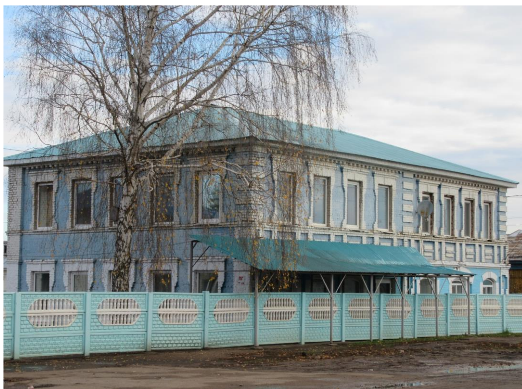
Дом и торговое заведение купца Николаева