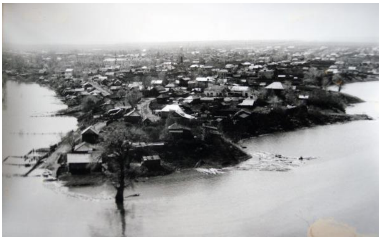
Старинная фотография села Кушнареново во время разлива реки Белая. Фото сделано с Девичьей горы