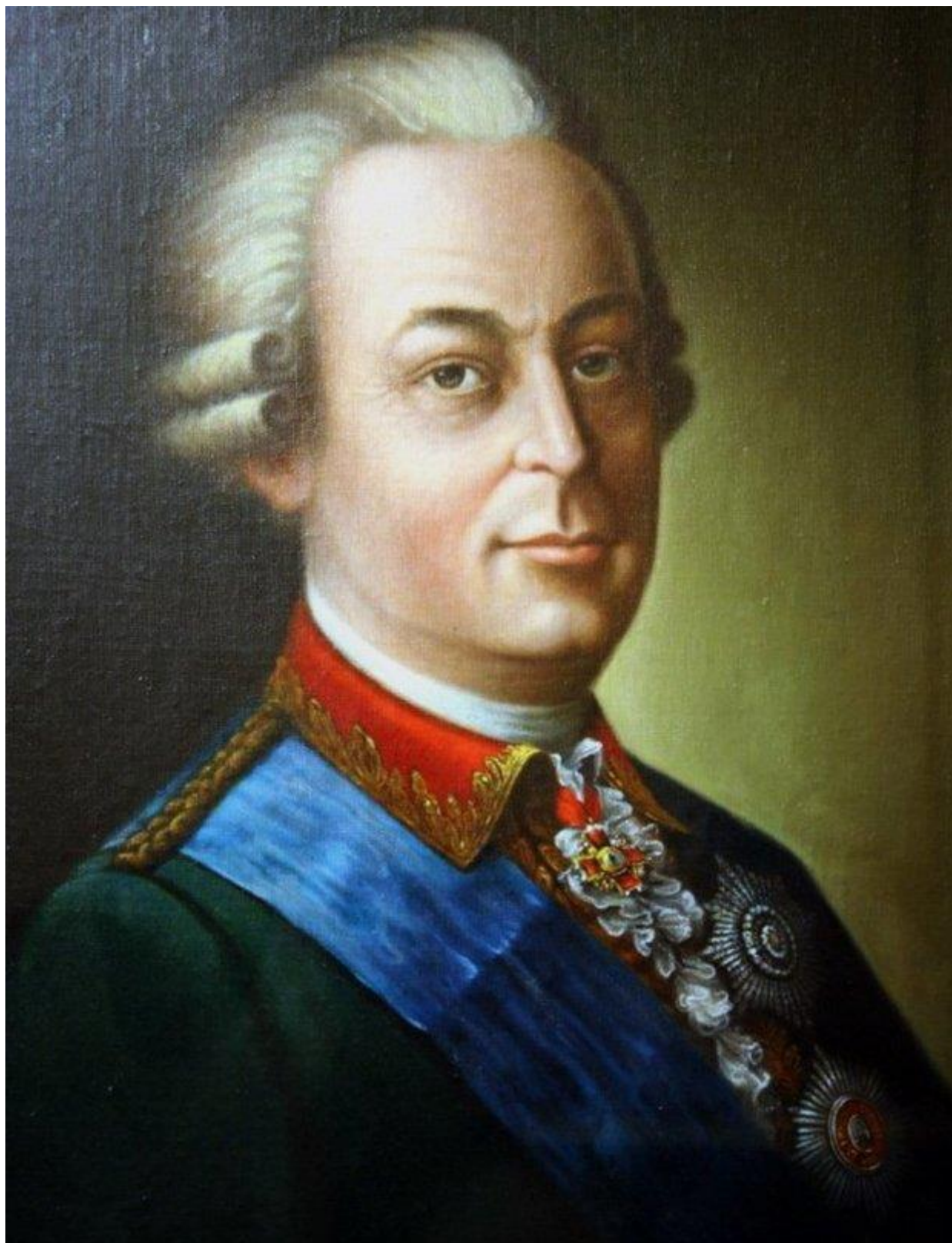
Суворов Василий Иванович