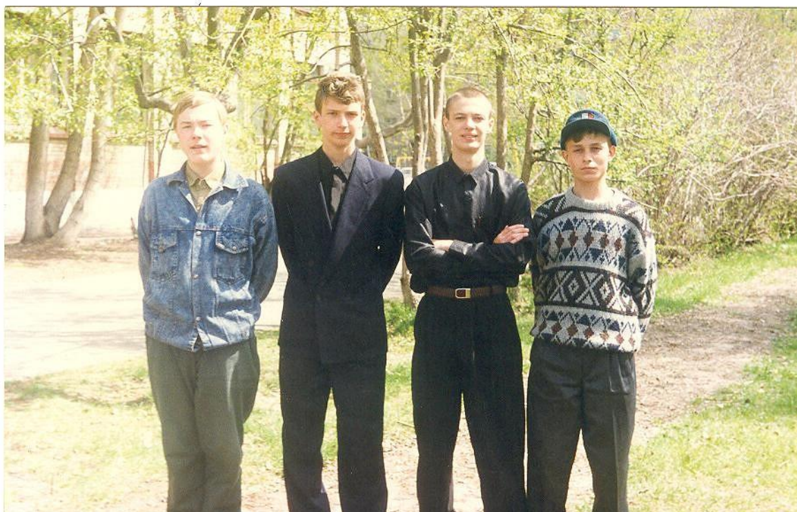
Фотография учеников 1995 год