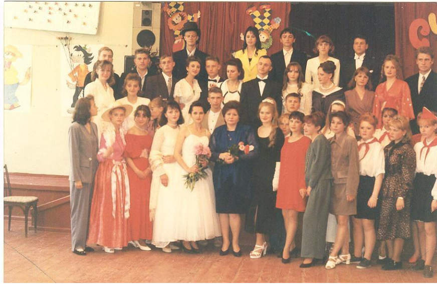
Литературно-музыкальная гостиная 1997 год