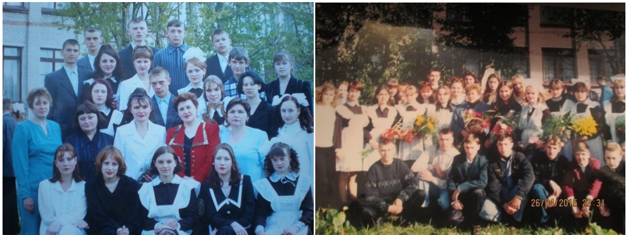
«Последний звонок», 11 класс, 2000 год и «1 сентября» 11 класс, 1997 год