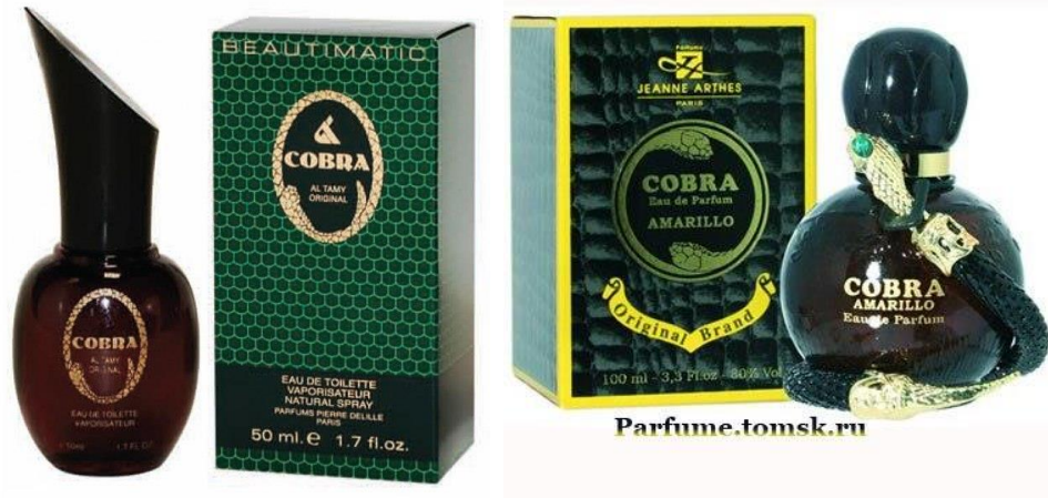
Знаменитый женский парфюм в 1990 годы «Кобра»