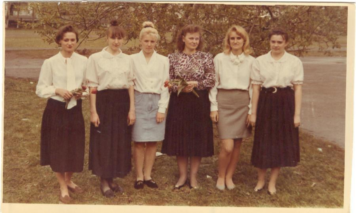
Практиканты из Педагогического Института 1994 год