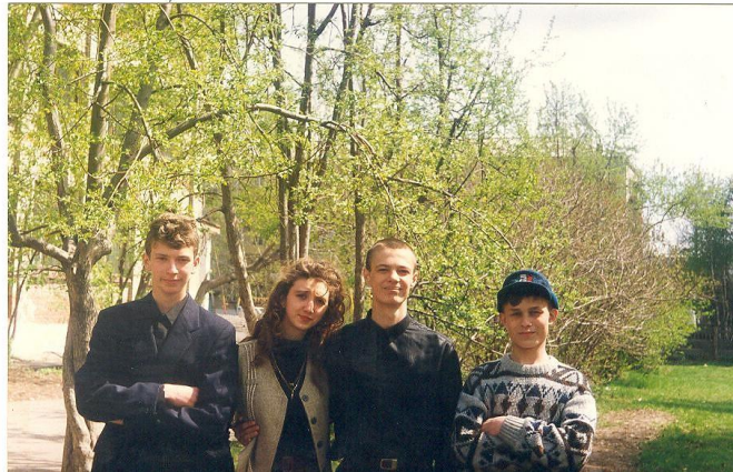
Фотографии из семейных архивов