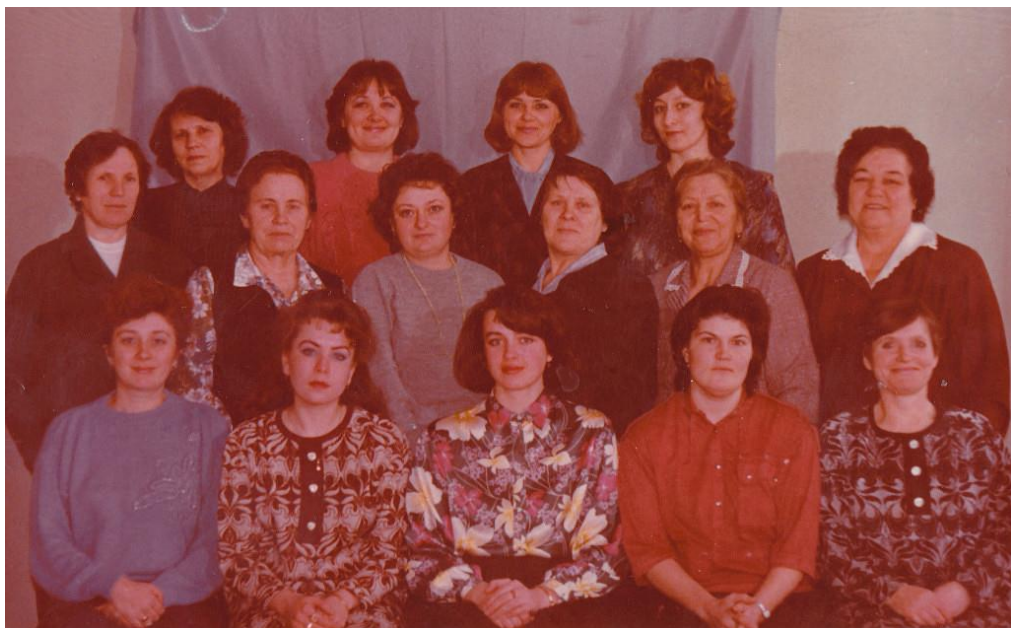
Фотография педагогического коллектива