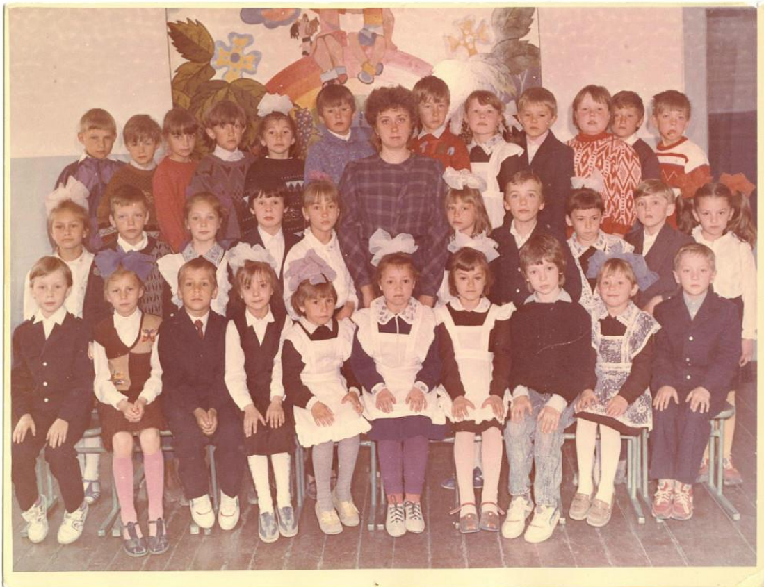
Фотография обучающихся 1 класса 1993 год