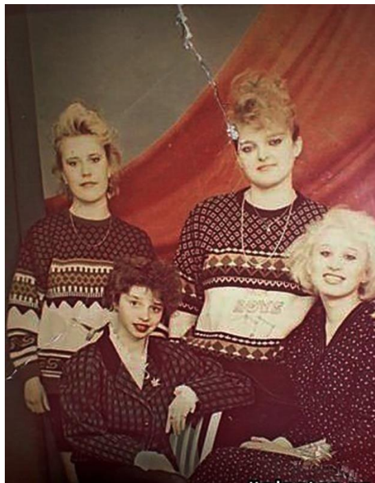
Модные тренды в одежде подрастающего поколения и молодежи в 90-е годы