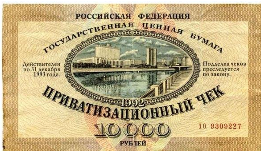
Фотография Приватизационного чека номиналом 10000 рублей, действительного до 31 декабря 1993 года