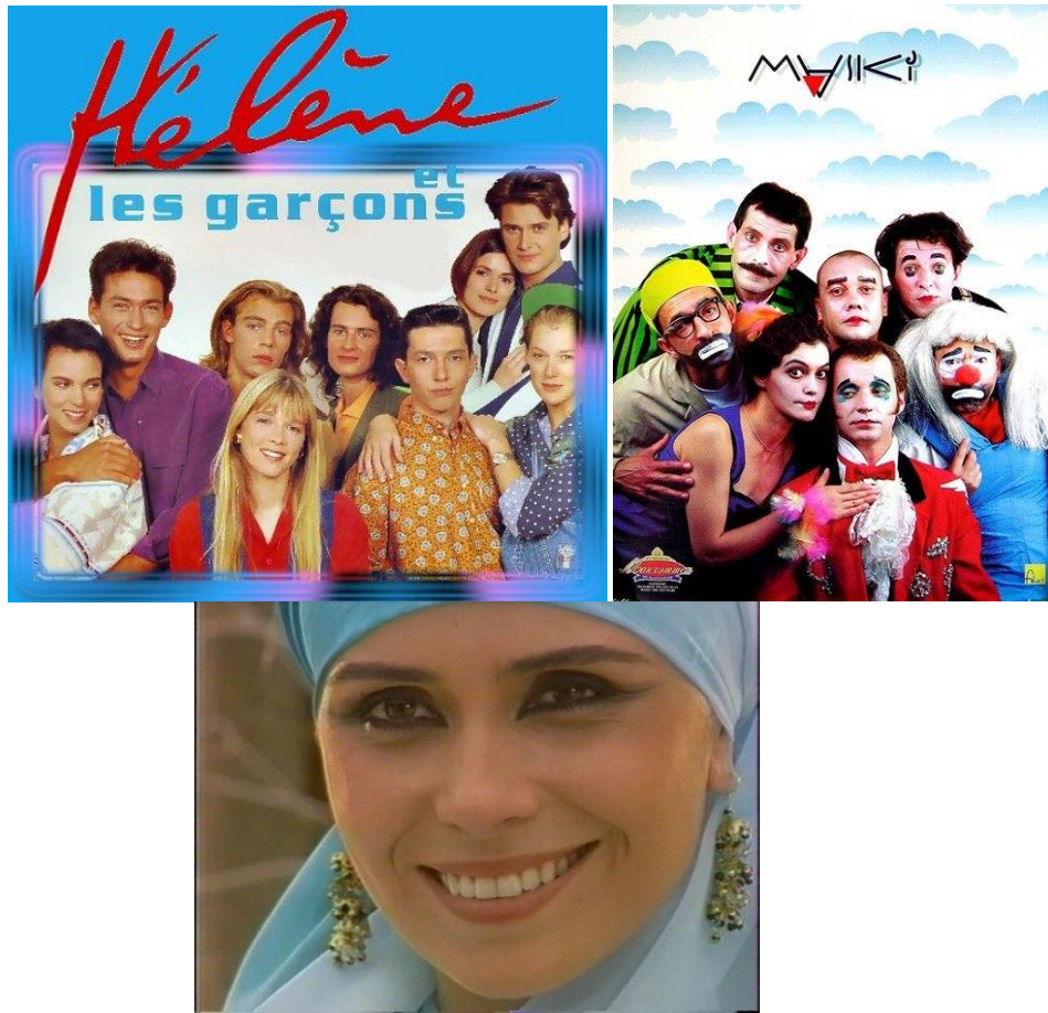
Новинки на телевидении в 1990-е годы