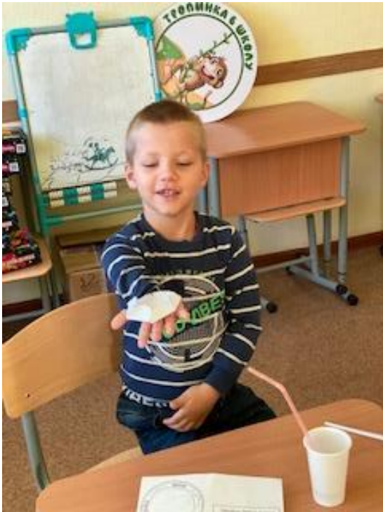
Рис. 1, 2 Готовим цветы для опыта