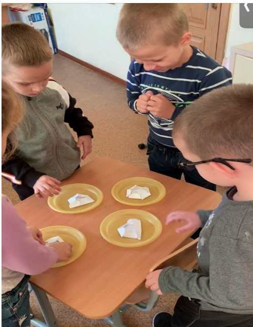
Рис.3 Опыт с бумажным цветком