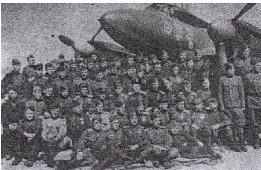
Авиаторы второй эскадрильи 58 Краснознаменного бомбардировочного полка после объявления о Победе, май 1945 г.

«9 мая 1945-го наш полк встретил в ожидании вылета под Данциг для уничтожения оставшихся группировок противника. О Победе нам сообщили около полуночи», - вспоминал прадедушке в разговоре с моим отцом.