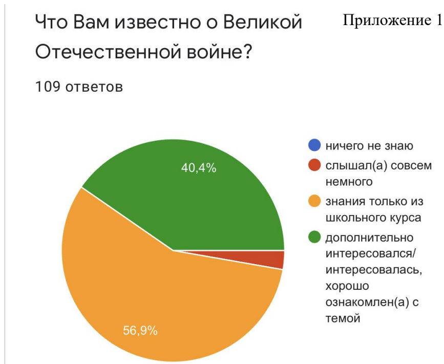
Диаграмма 1. Опрос на тему осведомленности о Великой Отечественной войне

необходимо помнить и чтить подвиги героинь и героев Великой Отечественной войны, благодаря которым сейчас мы можем жить спокойно.