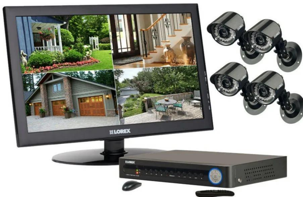
• Фото 2

Организует охрану и обеспечивает оснащение объекта (территории) современными инженерно-техническими средствами и системами охраны, в том числе видеонаблюдения, оповещения и управления эвакуацией. (охранник может отвлечься или не заметить ).(Фото3)