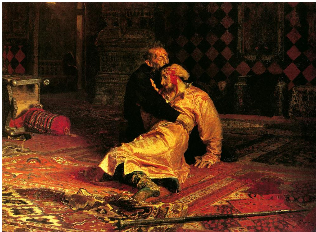
Илья Репин «Иван Грозный убивает своего сына»