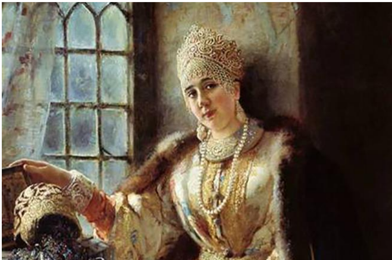
Анастасия Романова, первая жена Ивана Грозного