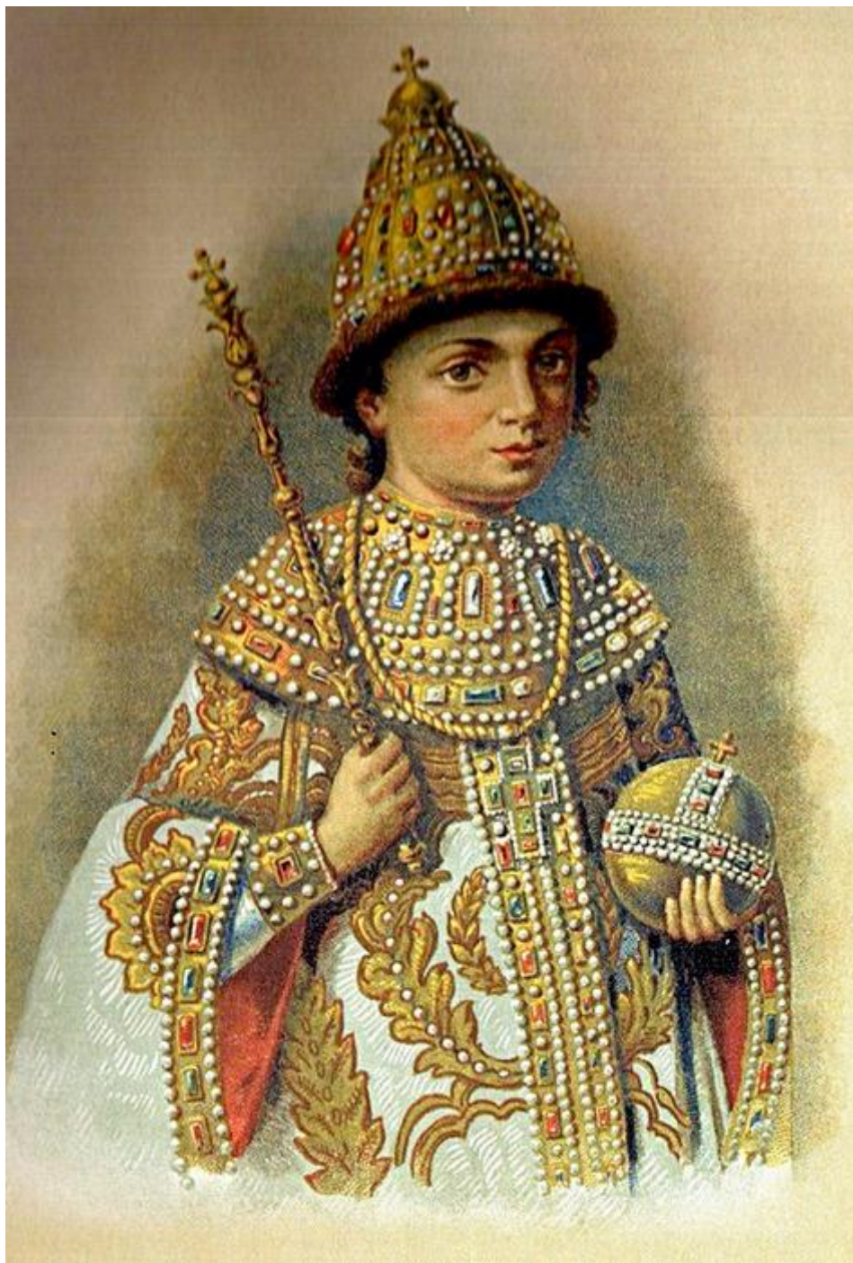
Малолетний Иван IV