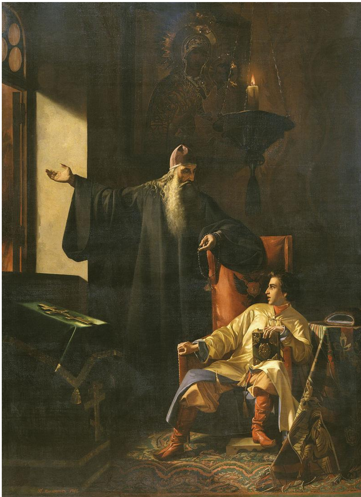
Иван IV и священник Сильвестр