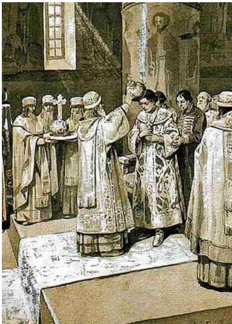
Венчание на царствование Ивана IV