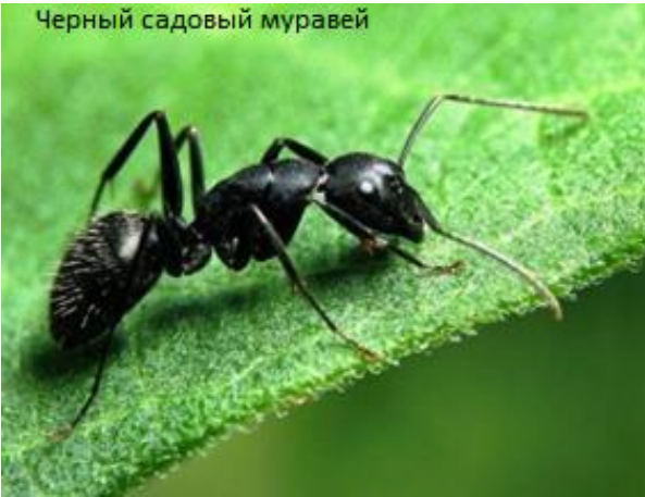
Черный садовый муравей