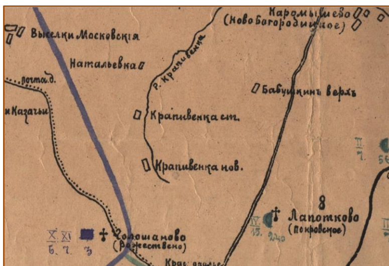
Рис. 2. Фрагмент карты Крапивенского уезда Тульской губернии (конец XVIII века). Местоположение Старой Крапивны на речке Крапивенке

рубежам Московского государства на тысячу верст от Мещорских болот до Дбрянских (Брянских) лесов (см. карту-схему, помещенную на рис. 2).