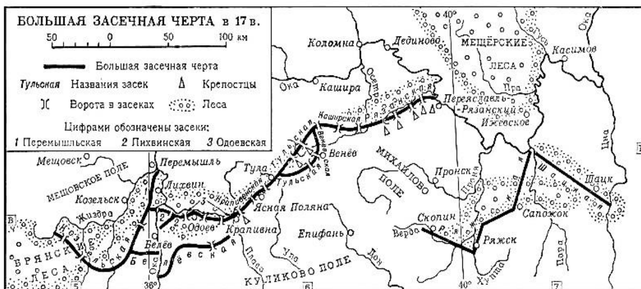
Рис. 1. Карта-схема Большой засечной черты Русского государства в XVII веке

...Это была одна из крепостей Засечной черты на Муравском шляхе – дороге из Крыма на Москву, шедшей мимо Белгорода и Курска. Леса тут являлись заповедными и поэтому сохранились почти первозданными, а кое-где дремучими и по сей день (см. карту-схему, расположенную ниже).