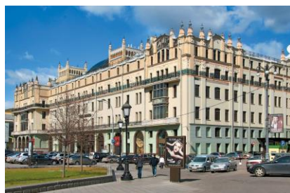
Гостиница Метрополь, Москва