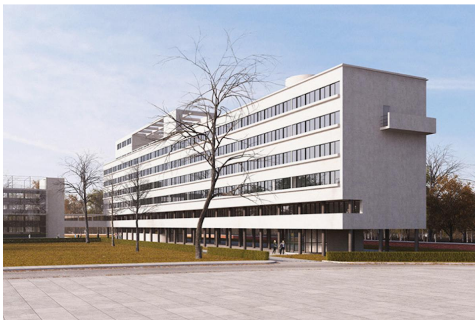
Дом Наркомфина, Москва

Ярким пример работы Гинзбурга - дом для работников Народного комиссариата финансов СССР на Новинском бульваре, известный как дом Наркомфина, построенный в 1930 году.