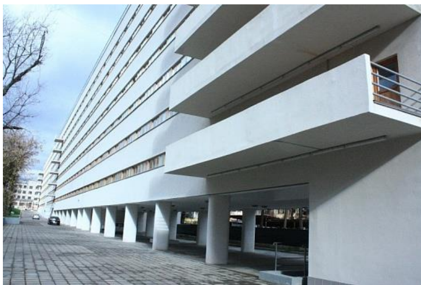
Дом-коммуна на улице Орджоникидзе, Москва

Среди наиболее известных зданий в стиле конструктивизм - Дом культуры имени Зуева, Дворец культуры ЗИЛа, дом-коммуна на улице Орджоникидзе в Москве, фабрика-кухня завода имени Масленникова в Самаре, Кушелевский хлебозавод в Санкт-Петербурге.