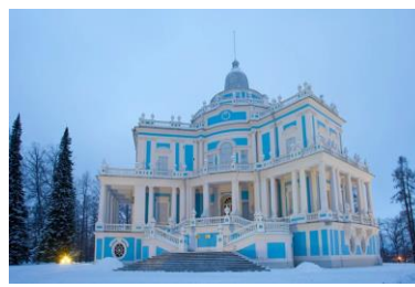
павильон «Катальная горка», Ораниенбаум