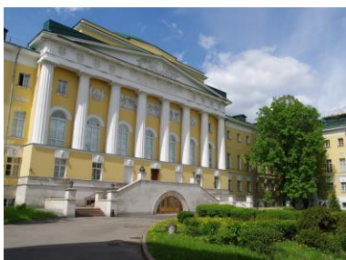
МГУ, старое здание, Москва