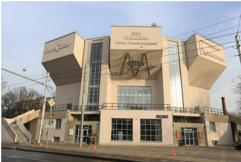
ДК Русакова, Москва

Имя архитектора Алексея Викторовича Щусева неразрывно связано с культовым сооружением СССР – мавзолеем В.И. ЛЕНИНА. Однако масштабных зданий в творческой судьбе российского и советского архитектора было значительно больше: проект Центрального телеграфа на Тверской улице; Центральный Дома культуры железнодорожников; гостиница «Москва»; Большой Москворецкий мост и многие другие.