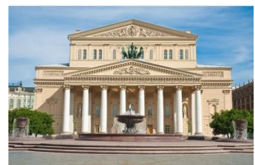
Большой театр, Москва