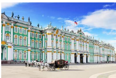
Зимний Дворец, Санкт-Петербург