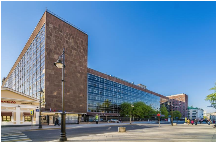
Здание Центрсоюза, Москва