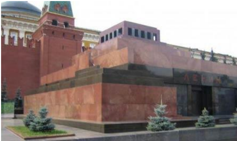
Мавзолей В.И. Ленина