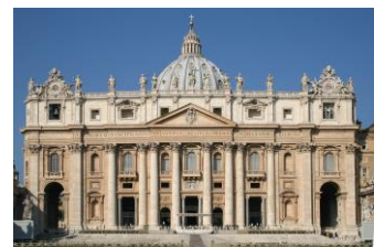
Собор святого Петра, Рим