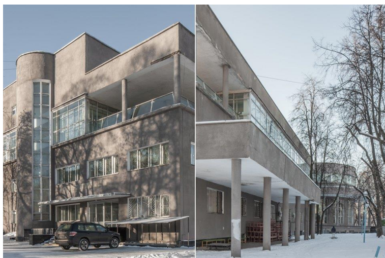
ДК ЗИЛ, Москва

Александр Веснин - лидер архитектурного конструктивизма. Выступал за современную функциональную архитектуру и рационализацию художественного труда. Самые известные работы А.Веснина: Дворец культуры завода имени Лихачева (ЗИЛ), Центральный дом киноактера, комплекс зданий Центрального аэрогидродинамического института (ЦАГИ), здание Мосторга на Красной Пресне.