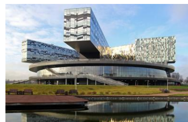
МШУ Сколково, МО

Строительство зданий пробуждает интерес к архитектуре своего города, городов нашей страны, мира и архитектуры в целом - как науки и искусства. Полученные впечатления и знания помогают создавать действительно интересные и уникальные постройки в своем мире Майкрафт.