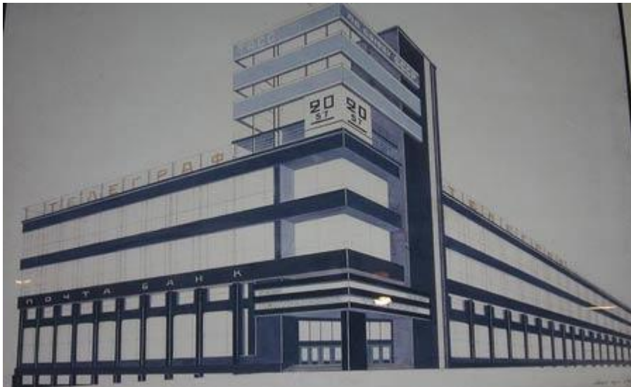
Конкурсный проект Центрального телеграфа на Тверской ул.

Среди иностранных представителей конструктивизма хочется отметить французского архитектора Ле Корбюзье. Здания по его проектам построены по всему миру – в Швейцарии, Франции, Германии, США, Аргентине, Японии, России, Индии и Бразилии. Характерные признаки архитектуры Ле Корбюзье — объемы-блоки, поднятые над землей; свободно стоящие колонны под ними; плоские используемые крыши-террасы и свободные пространства этажей.