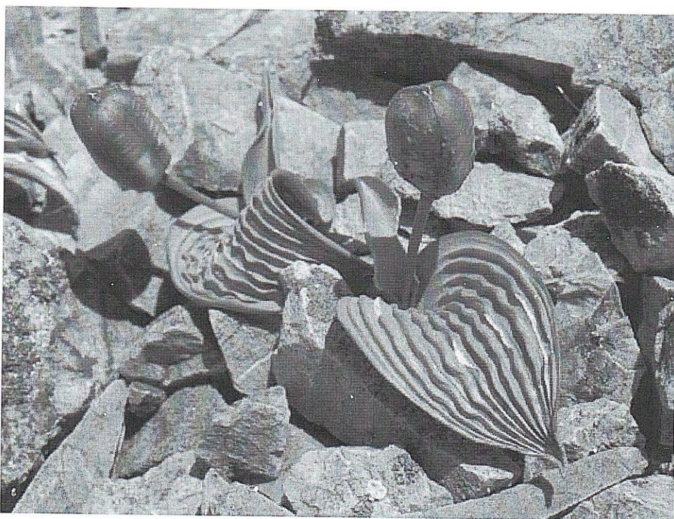
Тюльпан Регеля в горах Хонтау

Мне очень нравится этот цветок, а ещё я люблю чтобы дома были цветы. Поэтому я решила вырастить его сама и подарить маме! Подробности читайте ниже.