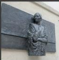
Верхнее фото- мемариал в Ленинградском Доме радио. Нижнее- мемориал на ул. Рубинштейна 7

Ольга Берггольц - знаменитая поэтесса. В годы Великой Отечественной она оставалась в осаждённом Ленинграде. С августа 1941 года работала на радио. Поэтесса была удостоена медали За оборону Ленинграда - за мужество и доблесть.