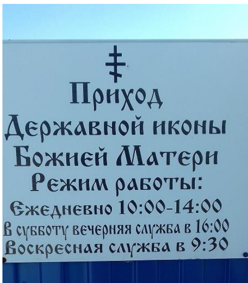
Внешний вид Домового храма в Татарском поселении