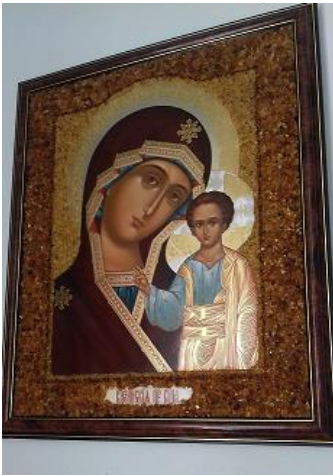
Икона Казанской Божьей Матери украшенная янтарём.