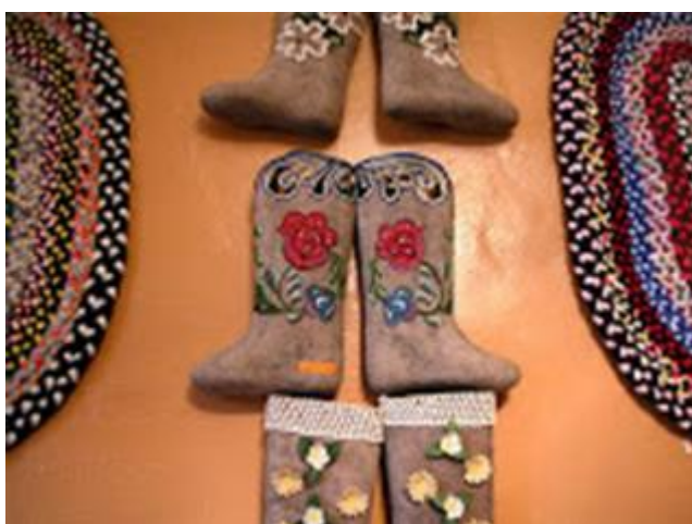
Музей русских валенок. Мышкино

Первое упоминание о войлочных сапогах нашлось в «Слове о полку Игореве» (12 век). Но эта обувь была скроенной и сшитой, она имела хотя бы один шов. Валенки в виде цельновалаемого сапога появились только в конце 18 века в Нижегородской губернии. Однако жители городка Мышкин в Ярославской губернии настаивают на том, что это они первые сваяли валенки.