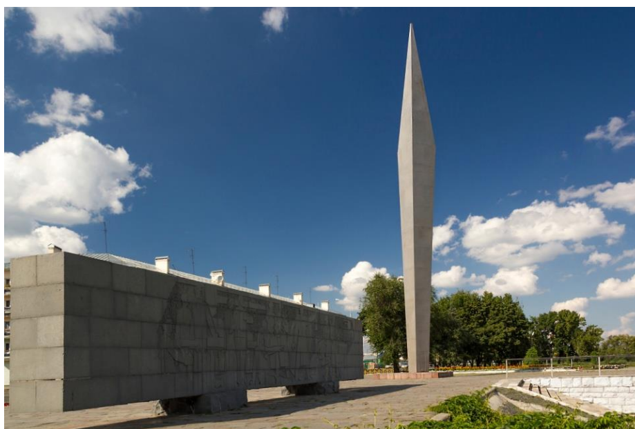
Рис. 2. Монумент Славы (восточная сторона, набережная р.Суры)

Стела «Слава Героям» – часть монумента Славы, расположенного там, где улица Славы «выходит» на набережную реки Суры в районе улицы Урицкого (см. Рис.2). Реставрирован в 2017 году.