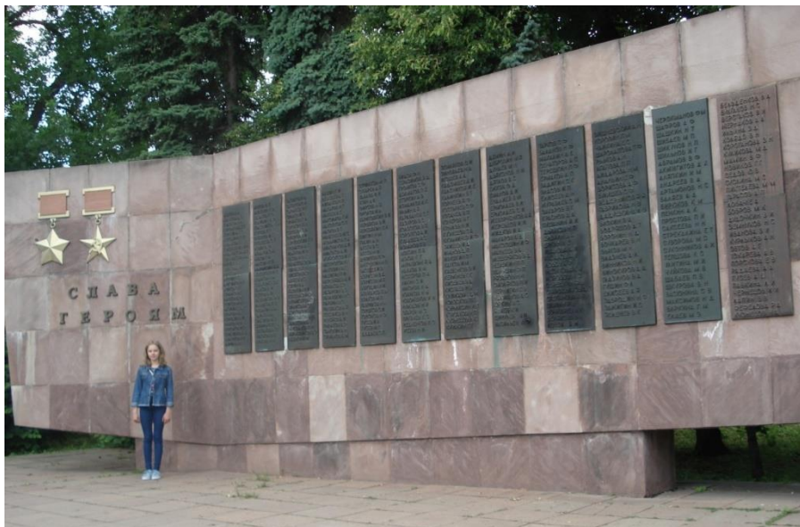
Рис. 5. Монумент «Книга Героев», 2017 г.