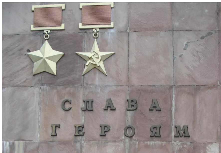
Рис. 6. Монумент «Книга Героев», 2017 г. (левая сторона)

В левой части «Книги Героев» размещены две награды: медаль «Золотая золотая звезда» Героя Советского Союза и медаль «Серп и молот» Героя Социалистического Труда. Под ними надпись «СЛАВА ГЕРОЯМ» (см. Рис. 6).