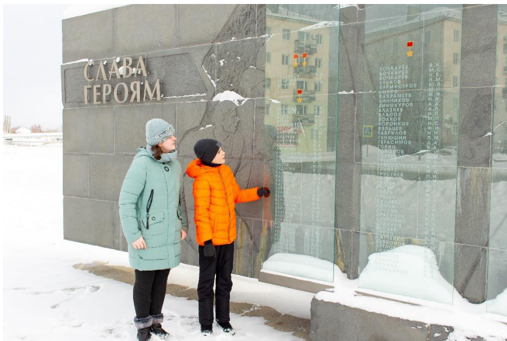
Рис. 4. Западная сторона стелы «Слава Героям», 2021 г. (стеклянные панели с фамилиями героев-пензенцев)

МОНУМЕНТ «КНИГА ГЕРОЕВ» (название заимствовано из проекта «Пензенский променад» (см. Приложение 1)).