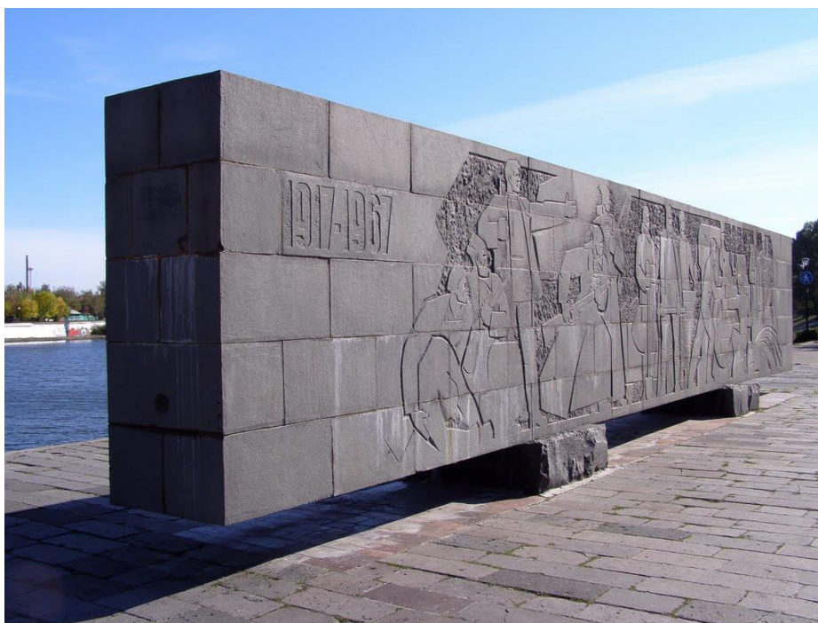
Рис. 3. Западная сторона стелы до реконструкции, 23.07.2011 г.