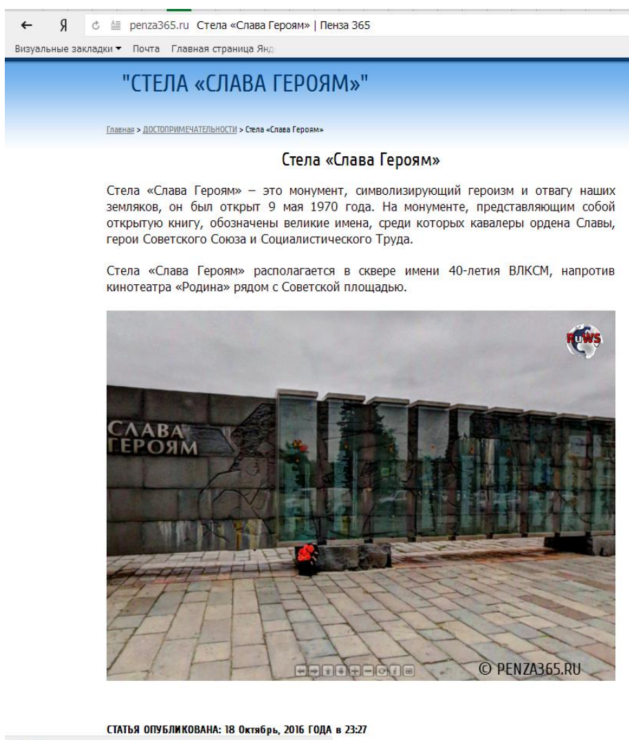
Рис. 1. Тематическая страница сайта «Пенза 365.RU».

На сайте «Пенза 365.RU» в разделе «Достопримечательности» размещена информация под названием «Стела «Слава Героям»». На рис. 1. мы показали данную страницу сайта.