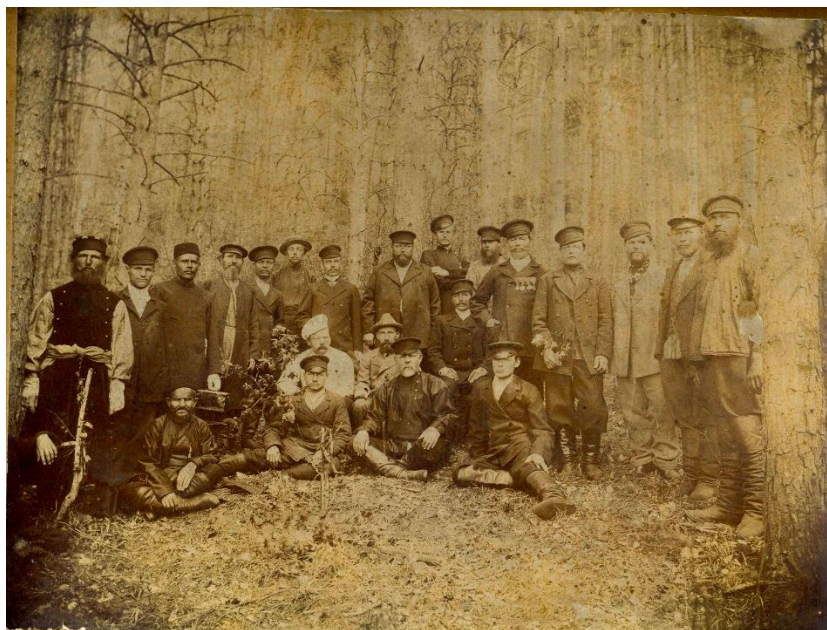
Рабочие Знаменского винокуренного завода . Фото конца XIX – начала XX века, хранится в Знаменском историческом музее, расположенном по адресу РБ, Белебеевский район, с. Знаменка, ул. Заводская, д.22