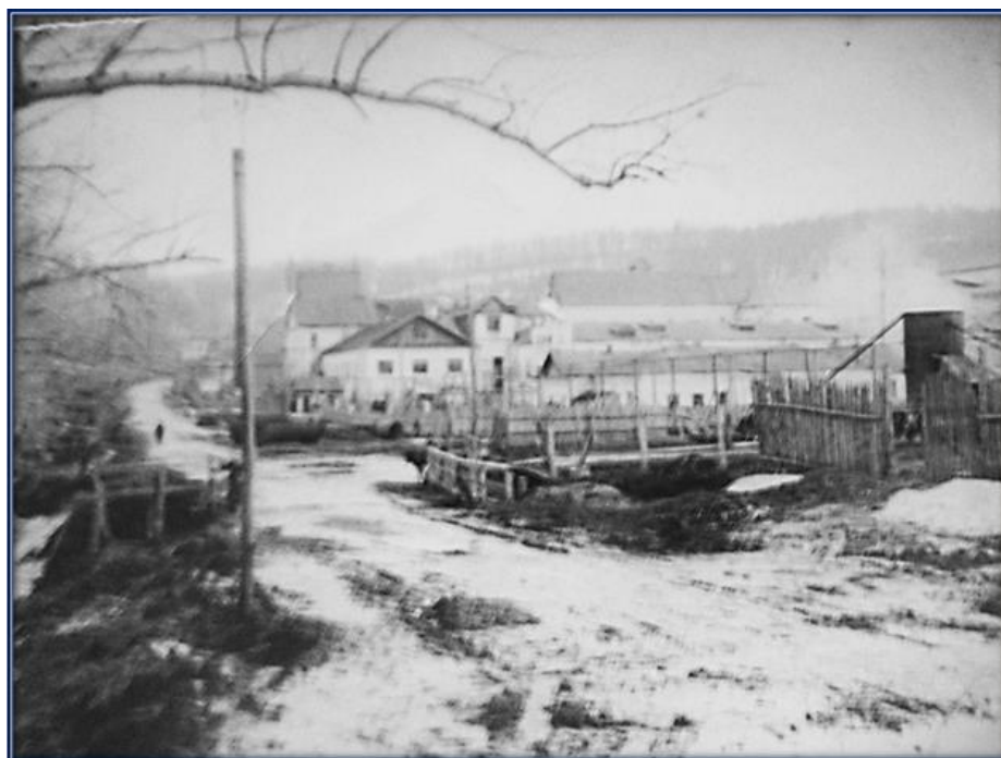
Винокуренный завод в селе Знаменка. Фото конца XIX – начала XX века, хранится в Белебеевском историко – краеведческом музее, расположенном по адресу: г. Белебей, ул. Красная, 83-а