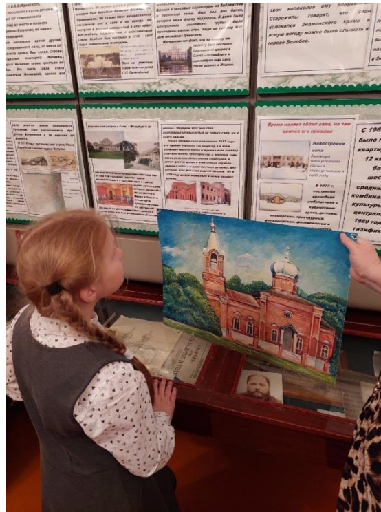
В поисках информации в историческом музее Знаменской средней школы.