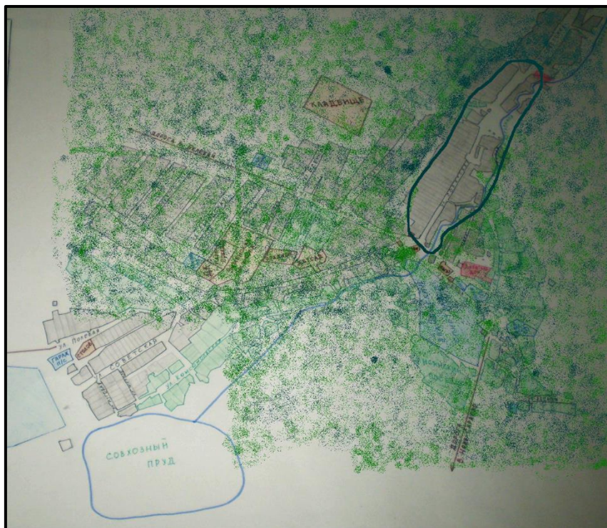
Территория деревень Нечаевка и Кутузыв XVII веке.