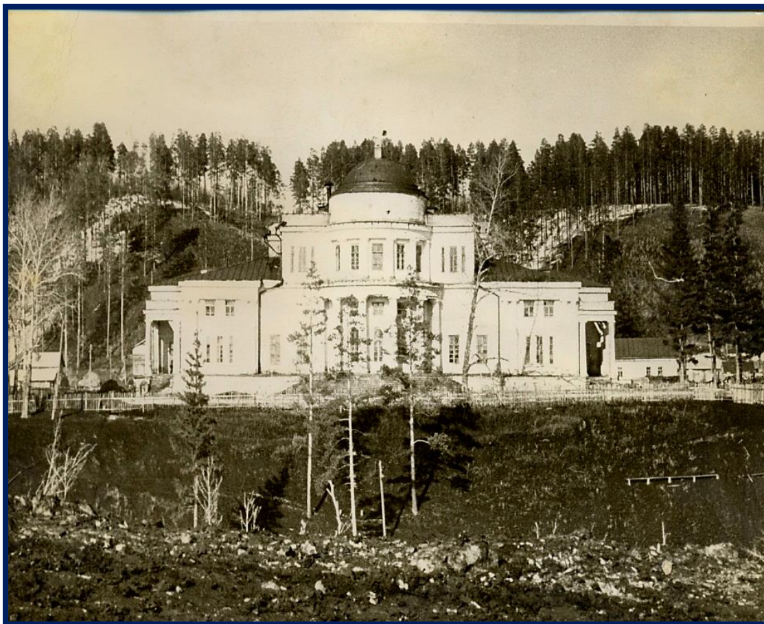
Дом-усадьба помещика Н.В. Деева Фото 60-х годов XX века, хранится в Знаменском историческом музее, расположенном по адресу РБ, Белебеевский район, с. Знаменка, ул. Заводская, д.22