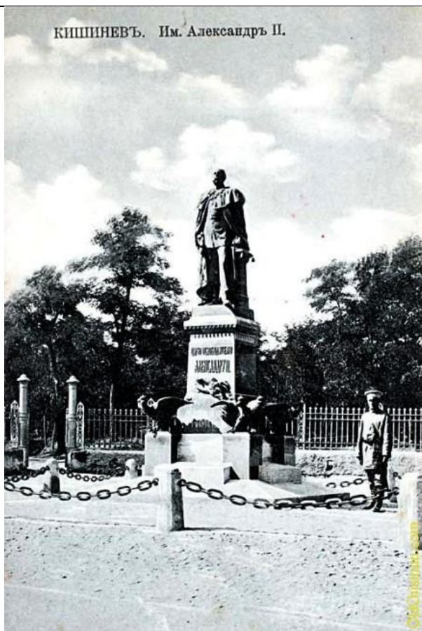
Фотография памятника Александру II.