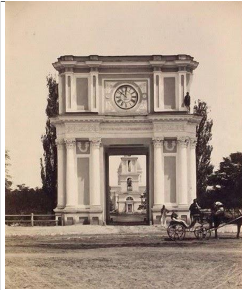
Фотография Триумфальной Арки. Построена в 1846 г.