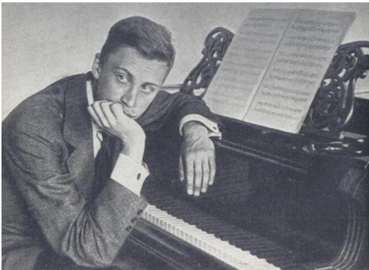
С. С. Прокофьев за роялем 1910 год.

и в жизни. Шахматы дисциплинировали, воспитывали и развивали его память с детства.