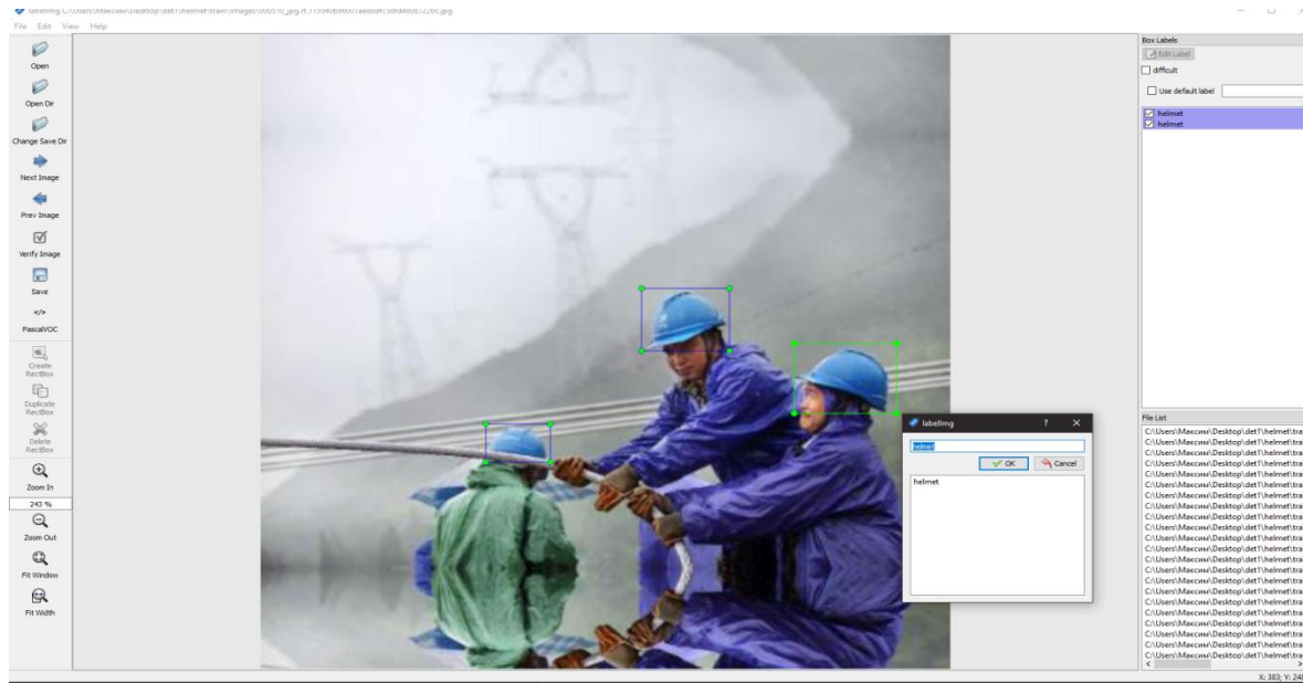
Фото 1. Разметка объектов

Для этого с помощью программы LabelImg я создавал аннотации к фотографиям, проще говоря, размечал нужные объекты на фото. Суммарно я разметил 800 фотографий вручную. Остальные изображения были уже аннотированы.