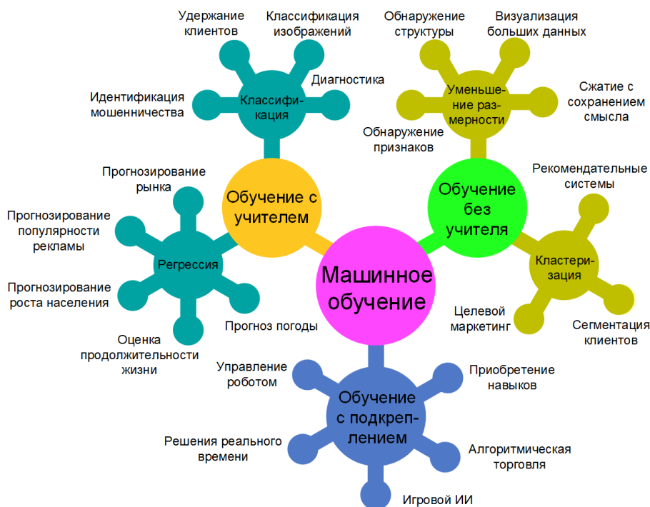
Кластер. Машинное обучение

Обучение без учителя — один из способов машинного обучения, при котором испытуемая система спонтанно обучается выполнять поставленную задачу без вмешательства со стороны экспериментатора [3].