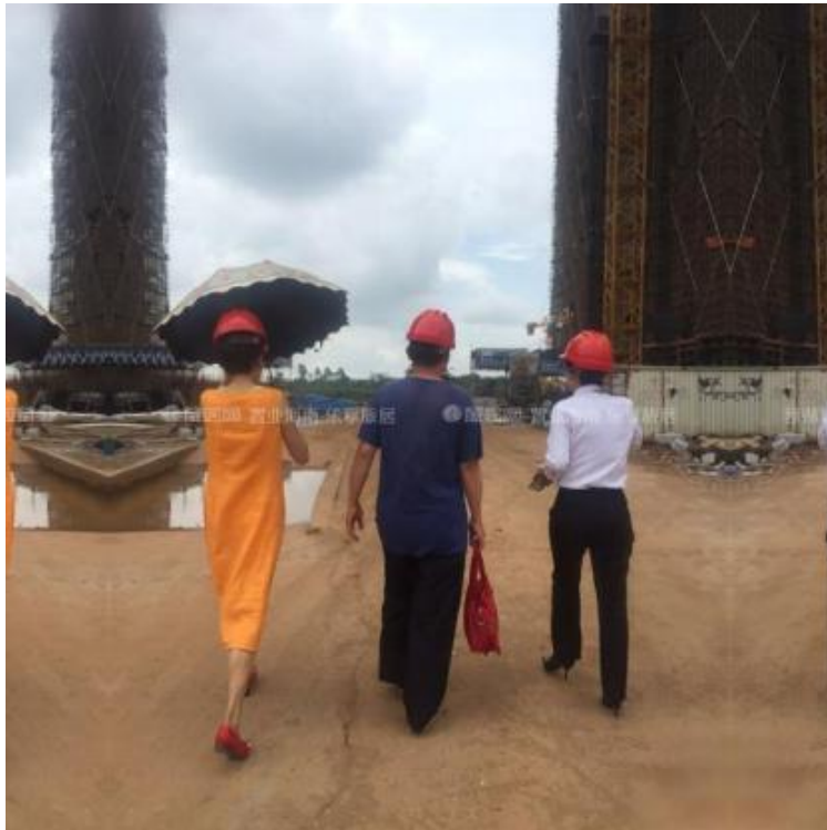
Фото 2. До обнаружения