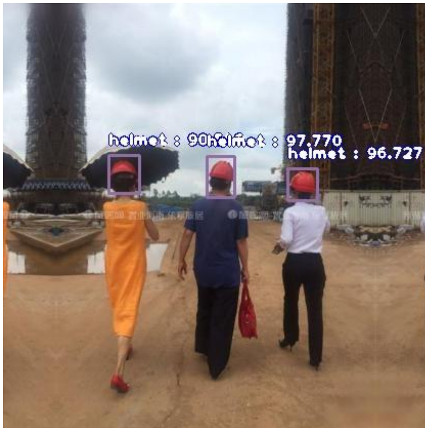
Фото 3. После обнаружения