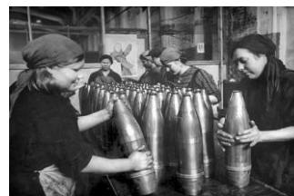
Работа на предприятиях