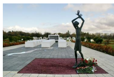
Мемориальный комплекс детям-узникам концлагерей в с. Красный Берег, Гомельская область,