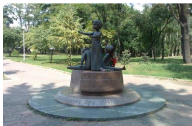
Памятник расстрелянным детям в Бабьем Яру, Киев, Украина Белоруссия