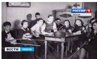
Культурная жизнь детей