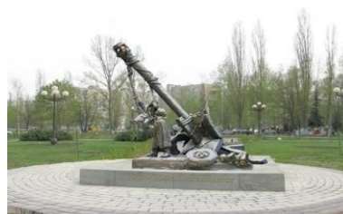
Памятник детям войны в г. Старый Оскол