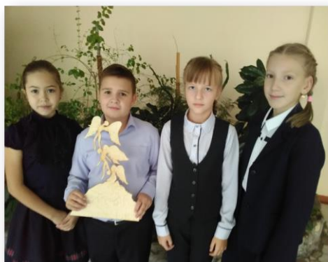
Проектный продукт: макет памятника