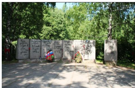
«Цветок жизни»(Ленинградская обл)