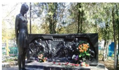
Памятник в г.Ейске