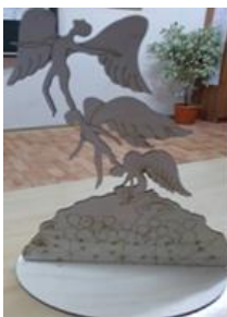
Макет памятника Детям войны