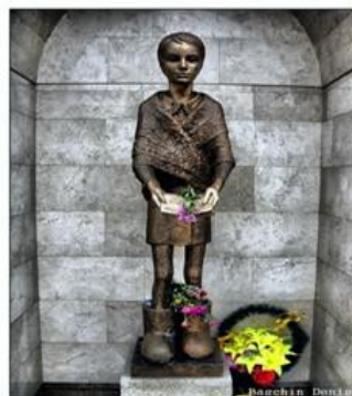
«Тане Савичевой и детям войны»(Новгородская обл)