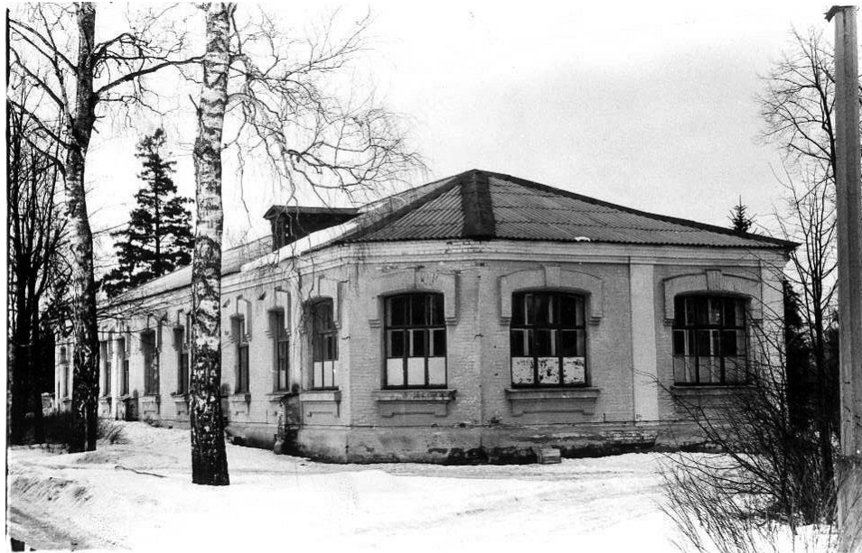
Один из сохранившихся старых корпусов