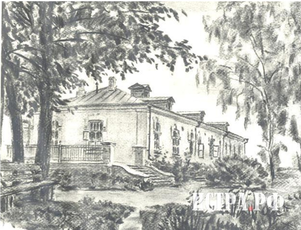
Рисунок Чикинской больницы