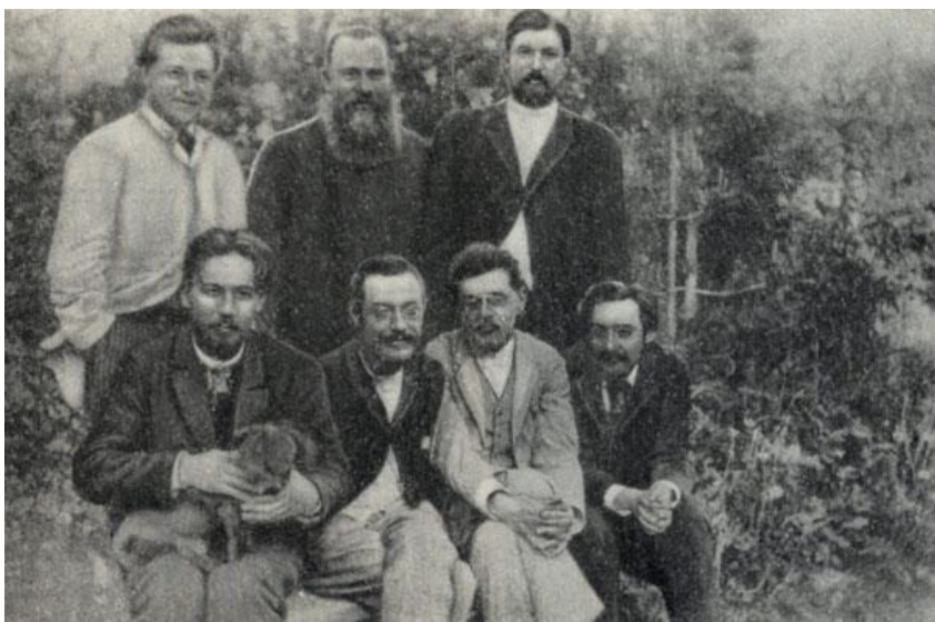
А. П. Чехов с коллегами по Воскресенской земской больнице