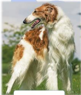
Русская псовая борзая