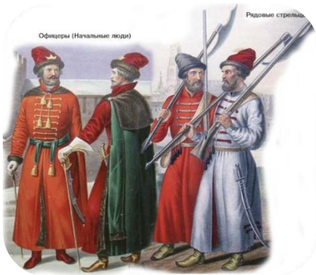
Стрельцы образца 17 века

18 июня 1698 г. здесь противостояли стрелецкое войско и петровские полки.