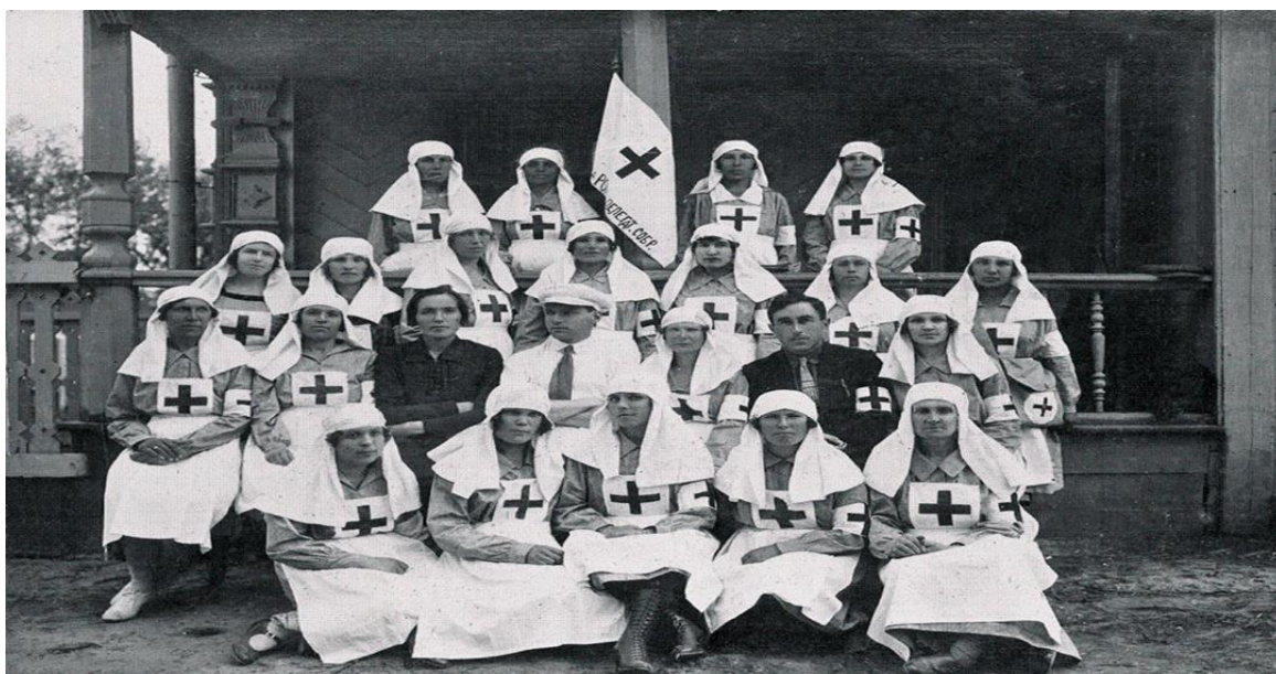
Рис.8. Российское Общество Красного Креста.

В послевоенное время Советский Красный Крест приходил на помощь народам зарубежных стран в ликвидации опасных инфекционных заболеваний, организации лечебных учреждений и развитии национального здравоохранения. Наши медики работали в Польше, Китае, Северной Корее при ликвидации эпидемий чумы, тифа, оспы. Были открыты больницы Советского Красного Креста в Иране, Эфиопии, Северной Корее. Советский Красный Крест оказывал безвозмездную помощь народам зарубежных стран в борьбе с эпидемиями, голодом, последствиями стихийных бедствий, вооруженных конфликтов. В эти страны были направлены экстренная помощь - палатки, одеяла, носилки, медикаменты, медицинские инструменты, перевязочные средства, продукты питания, большие партии вакцин против полиомиелита, оспы и холеры. Подвижные медицинские отряды Советского Красного Креста успешно работали в Перу, Иордании, Бангладеш, Алжире, Сомали, Эфиопии, и по настоящее время оказывают различную помощь. (рис.8)