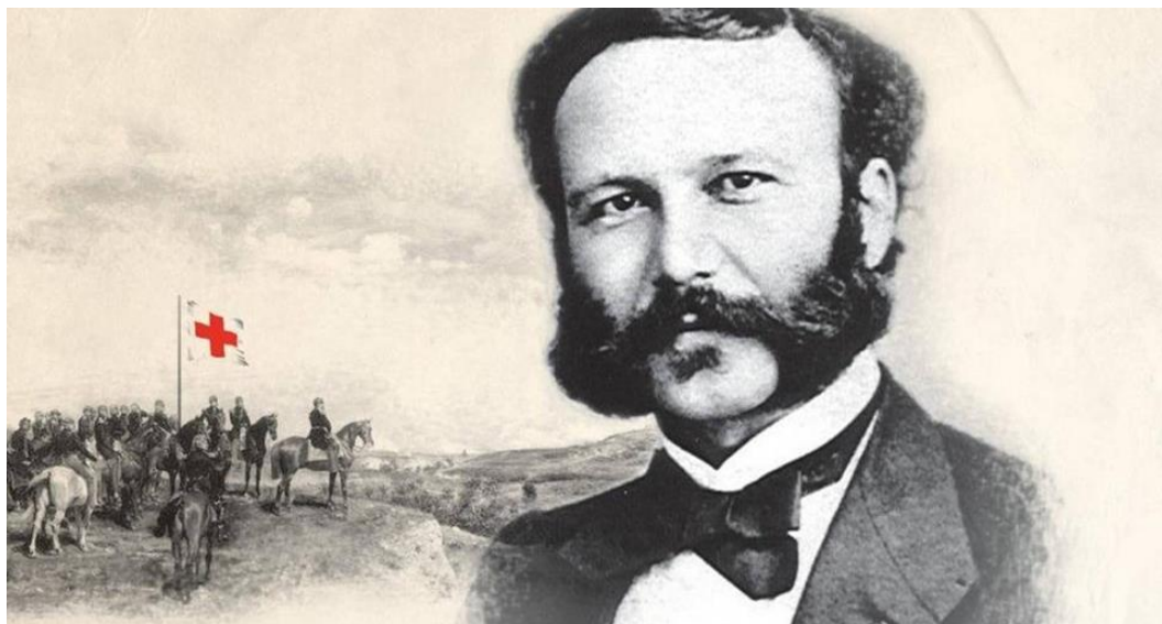
Рис.1. Фото Анри Дюнан.

Что мог сделать случайный свидетель, к тому же не имеющий медицинского образования? Мучаясь от собственного бессилия, Жан Анри Дюнан (рис.1) всё же остался. Забыв о предпринимательских интересах, он стал организовывать пункты помощи, ухаживал за ранеными, привлёк к делу добровольцев из числа местных крестьян. Это было важнее.