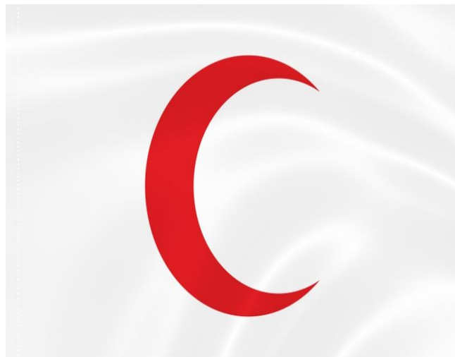
Рис.4. Красный крест на белом фоне и красный полумесяц на белом фоне.

В последующие годы национальные комитеты движения были образованы почти во всех европейских странах. В 1876 г. комитет утвердил название «Международный комитет Красного Креста», которое остается в силе по сей день. Через пять лет усилиями Клары Бартон был образован Американский Красный Крест. Число стран, подписавших Женевскую конвенцию, увеличивалось, её положения стали выполняться. Движение Красного Креста получило всеобщее признание, и работать в национальных комитетах соглашались многочисленные добровольцы (рис.5).