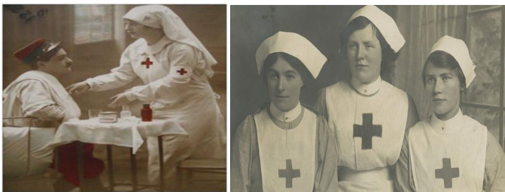
Рис.5. Добровольцы «Международный комитет Красного Креста».

В последующие годы национальные комитеты движения были образованы почти во всех европейских странах. В 1876 г. комитет утвердил название «Международный комитет Красного Креста», которое остается в силе по сей день. Через пять лет усилиями Клары Бартон был образован Американский Красный Крест. Число стран, подписавших Женевскую конвенцию, увеличивалось, её положения стали выполняться. Движение Красного Креста получило всеобщее признание, и работать в национальных комитетах соглашались многочисленные добровольцы (рис.5).