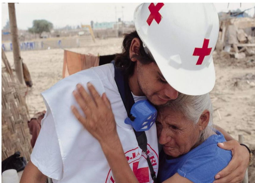
Рис.9. Помощь пострадавшим.

Международные комитеты Красного Креста и Красного Полумесяца на местах, проводят активную поддержку детей оказавшиеся в центре вооруженного конфликта, в данный момент это является приоритетным направлением деятельности Красного Креста. Международное движение Красного Креста и красного полумесяца и сегодня занимается активной гуманитарной деятельностью. Оказывает всевозможную правовую и посредническую поддержку как мирному населению, которые были втянуты в вооруженный конфликт, не по своей воле, так и правительствам воюющих