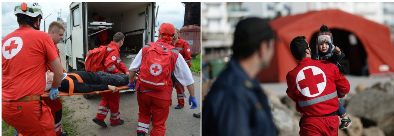
Рис.10. Миротворцы - посредники.

сторон выступая в данном случае в качестве независимого миротворца - посредника (рис.10).