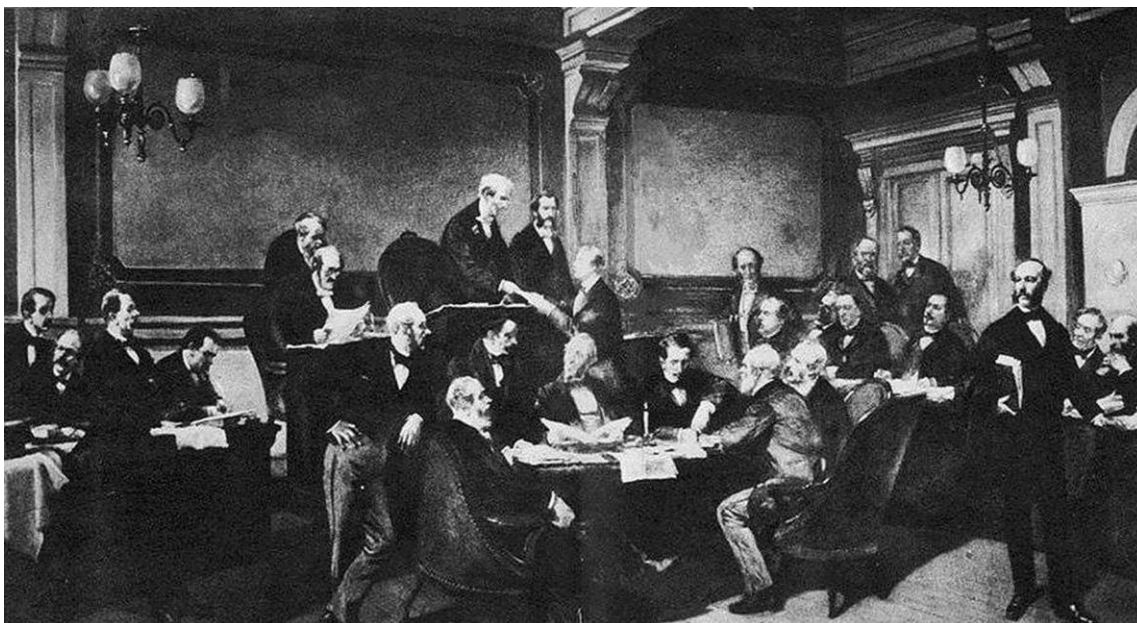
Рис.3. Конференция с правительствами всех европейских стран и США, Бразилии и Мексики.

Через год состоялась дипломатическая конференция, на которую пригласили правительства всех европейских стран и США, Бразилии и Мексики (рис.3).