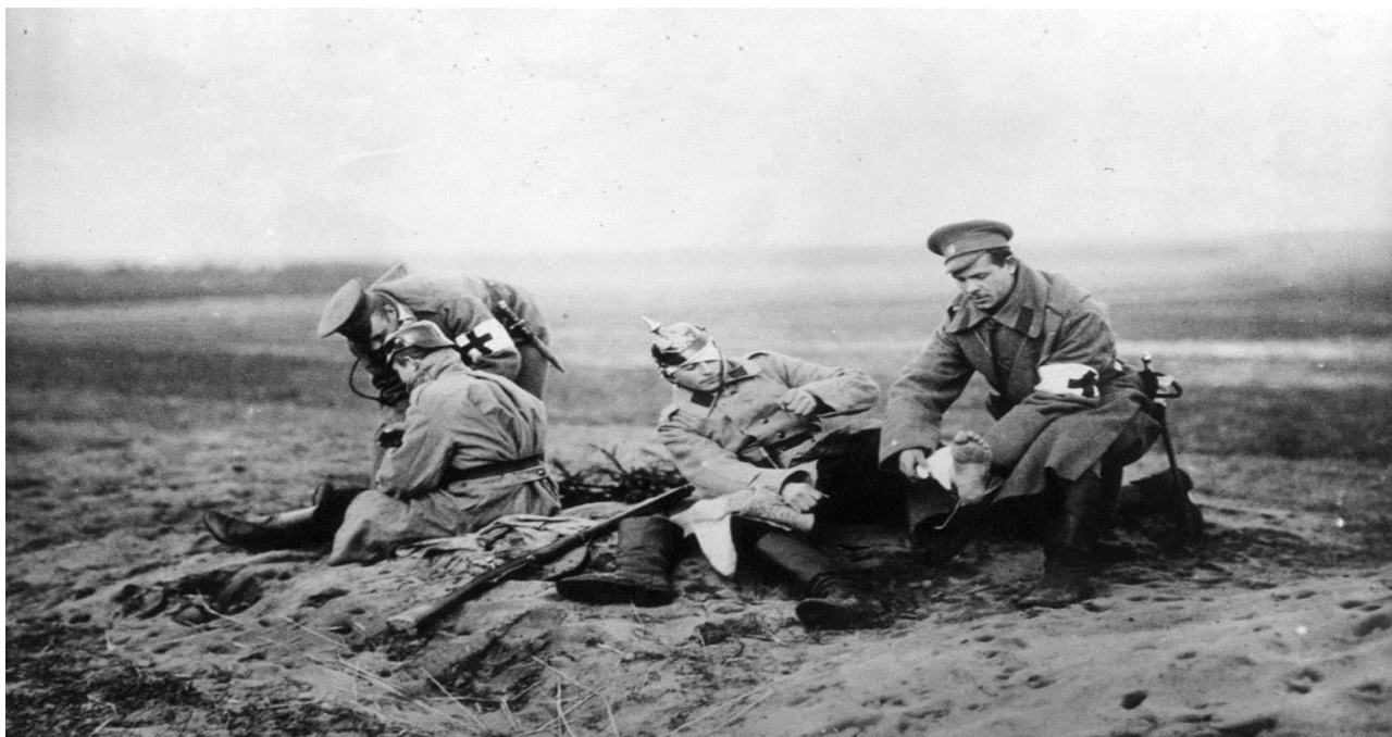
Рис.7. Красный Крест во время Второй мировой войны.

Несмотря на это, Международный комитет Красного Креста во время Второй мировой войны проводил: инспекцию лагерей военнопленных, организацию помощи мирному населению, обеспечение возможности переписки военнопленных, сообщение о пропавших без вести. К концу войны 179 делегатов совершили 12750 посещений лагерей военнопленных в 41 стране. Агентство обеспечило пересылку 120 млн. писем. Значительным препятствием было то, что Немецкий Красный Крест, который контролировали нацисты, отказывался соблюдать Женевские статьи. Международный комитет сумел идентифицировать примерно 105 тыс. заключенных и передать около 1,1 млн. посылок, в основном в Дахау, Бухенвальд, Равенсбрюк и Заксенхаузен (рис.7).