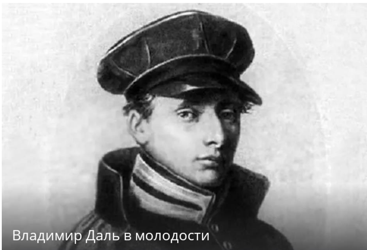
Владимир Даль в молодости

После окончания Морского кадетского корпуса в 1819 году юного мичмана Даля направили служить на Черноморский флот. Тогда-то Владимир и начал записывать диалектные слова. С тех пор при каждом удобном случае записная книжка пополнялась новыми заметками.