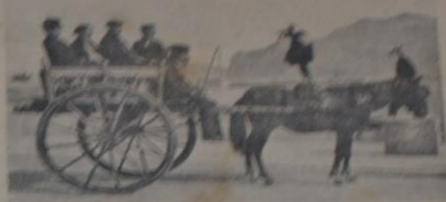
Сицилийская уличная конюшня.

Наше путешествие ходило в Палермо в 9 часов вечера. Во всеобщей столовой были уже накрыты столы, и иностранцы пригласили пассажиров к себе. Рядом со мной сидел русский турист, уныл и бледен, кто был пропущен изотопками слани, напротив помещался американец — один из тех