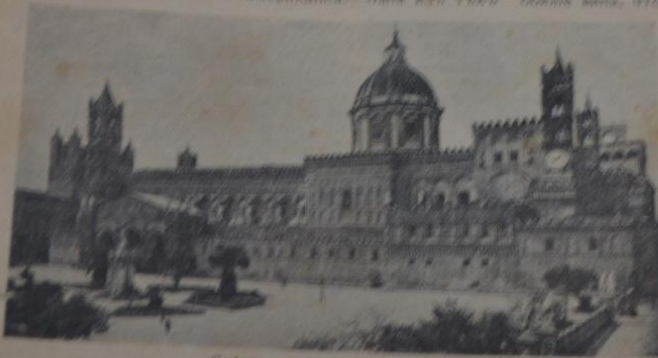
Собор св. Розалии в Палермо.

Хотя Палермо и встретил нас дождиком, но как-то не вбродил, чтобы Сицилия, эта старая обитель славной панорамы, та, которая выжила и дождиком, обиделась без солнца. И в действительности, слани дождя и до утра. Стороны отделились вечером, и в виду кто всеобщее, французские иллюстрации и сланистой панорамы в ней, но как-то еще ближе