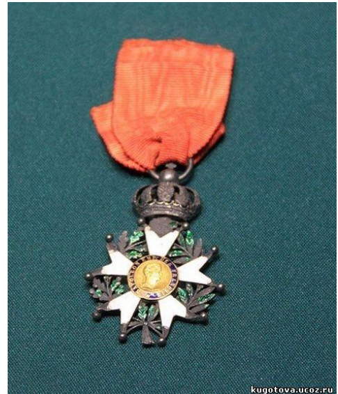
За 2 место – «Офицерский крест кавалера ордена Почетного легиона Франции Наполеона»