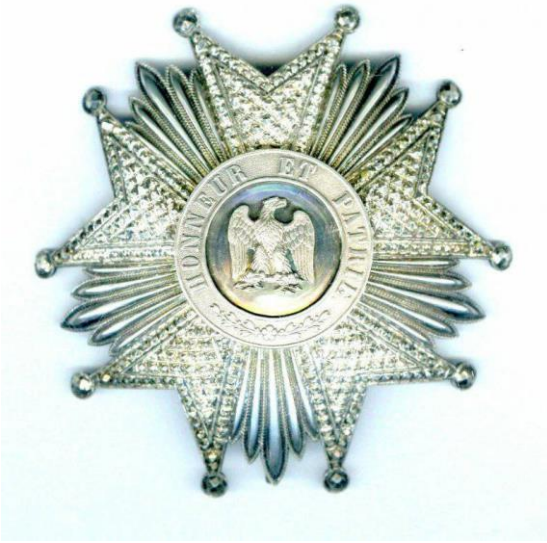
За 1 место – «Звезда высшей степени ордена Почетного легиона Франции Наполеона»