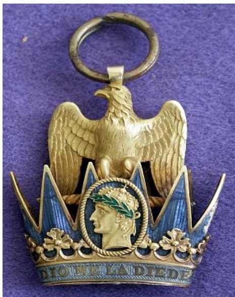
За 3 место – «Орден Железной короны»