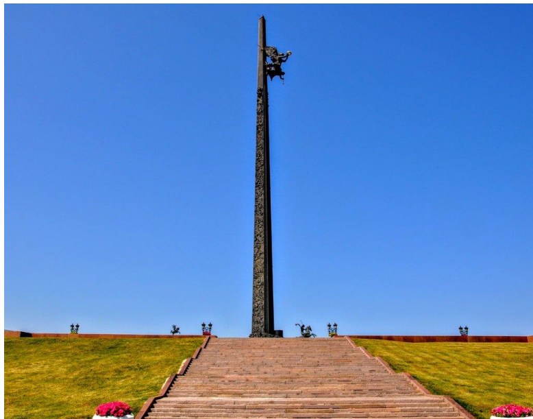
Рис.2 Монумент Победы (Парк Победы, г. Москва)

силы, но со временем собранные в народе деньги иссякли и строительство заморозили на 10 лет. Первоначально образ монумента Победы был другим — на первых схемах это был памятник, где нескольких советских солдат поднимают в небо, держа в руках образ Ленина. Автор проекта, архитектор А.Т. Полянский, скончался, и облик монумента Победы изменился кардинально.