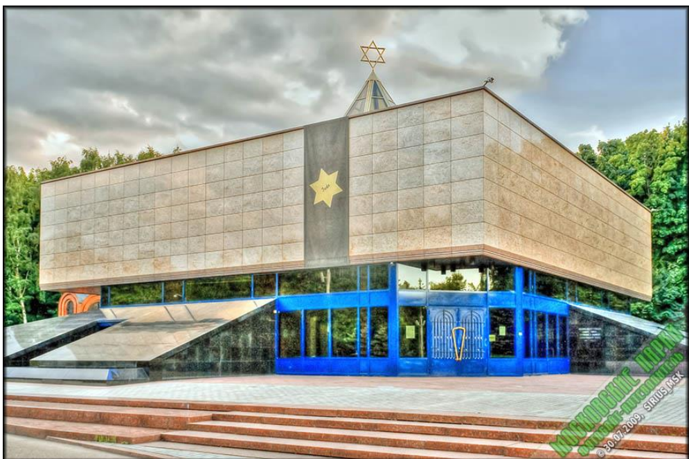
Рис.6 Мемориальная синагога

Здание Храма Памяти – Синагоги (Рис.6, было построено и торжественно открыто 2 сентября 1998 года. Здание синагоги строилось на основе концепции архитектора Израиля Моше Зархи. На открытии присутствовал Президент России. В цокольном этаже и на галерее молельного зала была оформлена выставочная экспозиция, посвященная еврейской истории и холокосту.