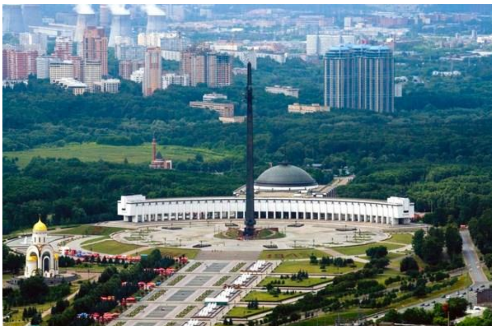
Рис.1 Парк Победы на Поклонной горе

Раньше Поклонная гора была действительно горой, с которой Москва была видна как на ладони. Сейчас же это небольшой холм, с которого можно увидеть разве что многочисленные многоэтажки, разбросанные вокруг, и Парк Победы, который заложили возле Поклонной горы в 1958 г. вместе с мемориальным комплексом, построенным в честь нашей победы в Великой Отечественной Войне.