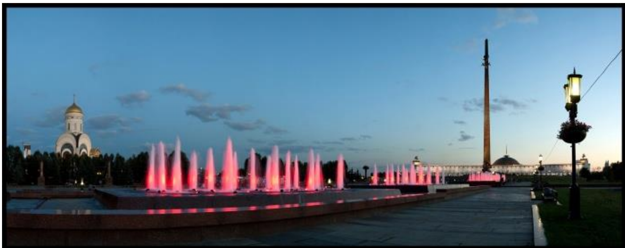
Рис.3 Фонтанный комплекс «Годы войны» (Парк Победы, г. Москва)

В 2008 году «Российская газета» присвоила фонтану звание «Самый патриотичный». А через десять лет комплекс «Годы войны» претендовал на звание «Самого интересного места Москвы».