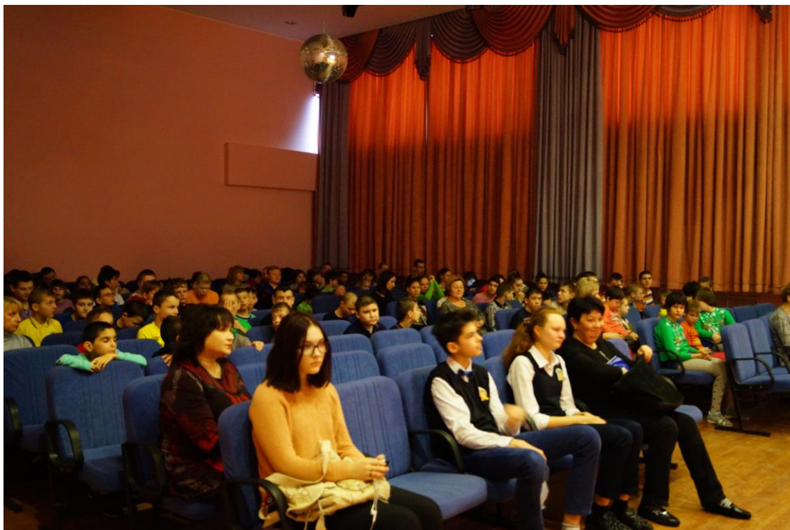
Приложение 2. Фото благотворительного концерта учащихся СОШ №15 для воспитанников Коломенского детского дома