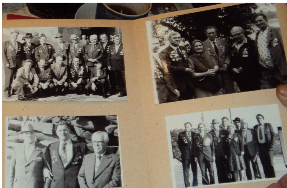
Фото 5. Страницы семейного альбома Белова У.П.