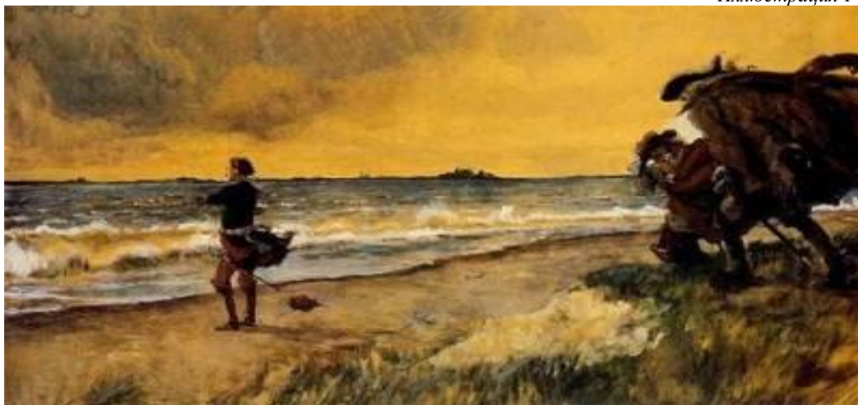
Петр Великий думающий о строительстве Санкт-Петербурга