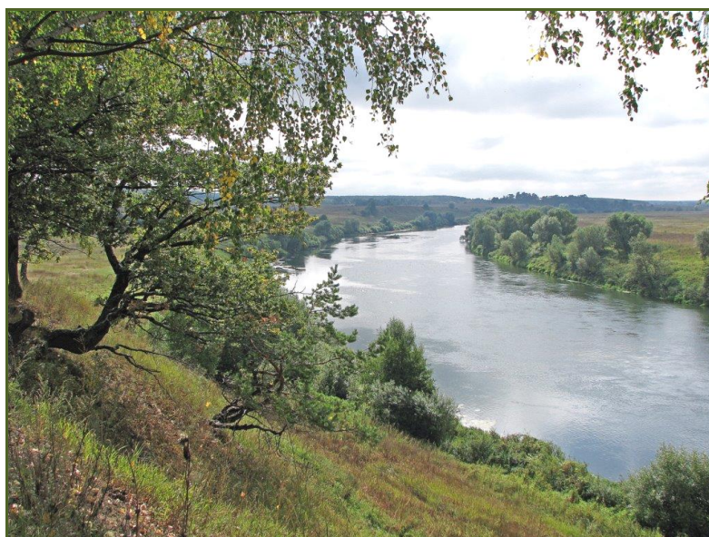
Побережье реки Оки вдоль автодороги на Бунырево