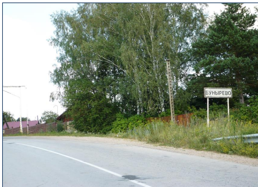
Указательный знак на въезде в село Бунырево