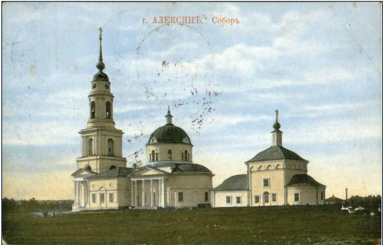
Старинная открытка с фото ансамбля Нового Свято-Успенского собора и Старого Свято-Успенского собора (начало XX века)