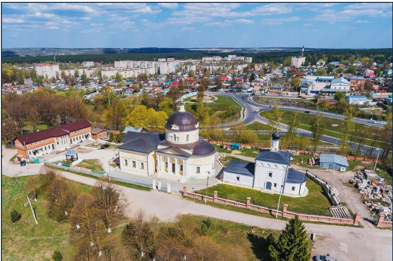
Современный вид старого города Алексина с ансамблем двух отреставрированных Свято-Успенских соборов в центре фото