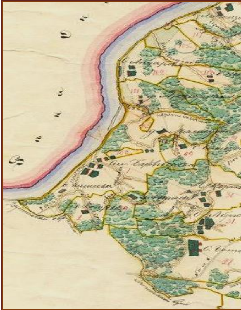
Фрагмент Плана Генерального межевания в конце XVIII века Алексинского уезда Тульской губернии (показано местоположение сельских поселений Буныревского прихода)