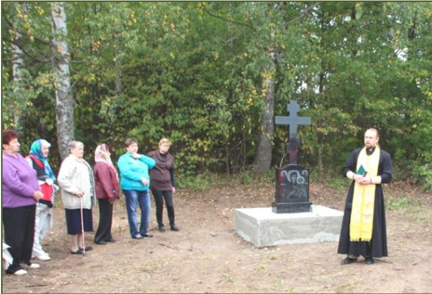
Освящение Поклонного креста, установленного в сентябре 2017 года на месте Благовещенского храма в селе Бунырево