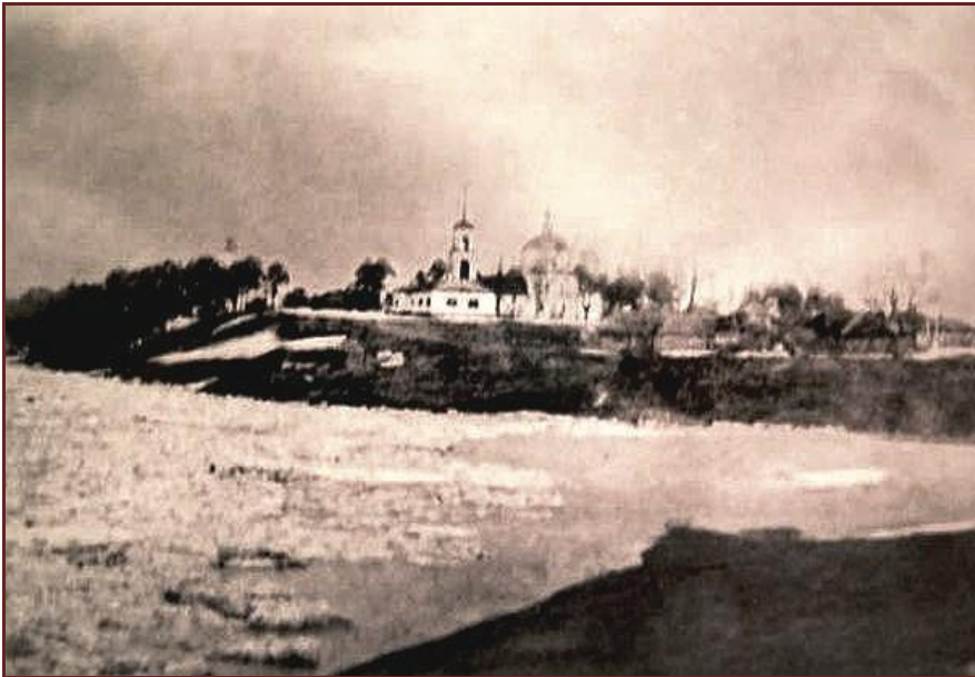
Тульская область, Бунырево. Церковь Смоленской иконы Божией Матери (утрачена в 1930-е годы) https://vk.com/club38475773

А вот так скорописью название села изображалось в некоторых хозяйственных и делопроизводственных документах XVII-XVIII вв. https://vk.com/club38475773