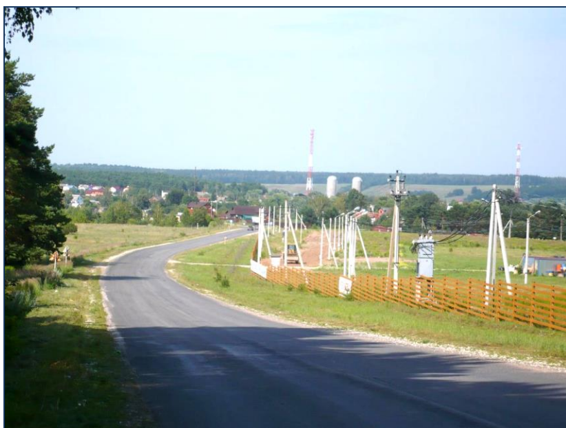
Шоссейная дорога из г. Алексина в с. Бунырево