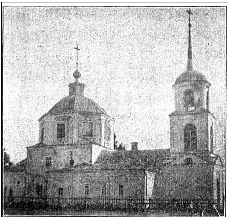
Рис. 22. Церковь с. Бунырева, Алексинского у., Тульской губ.