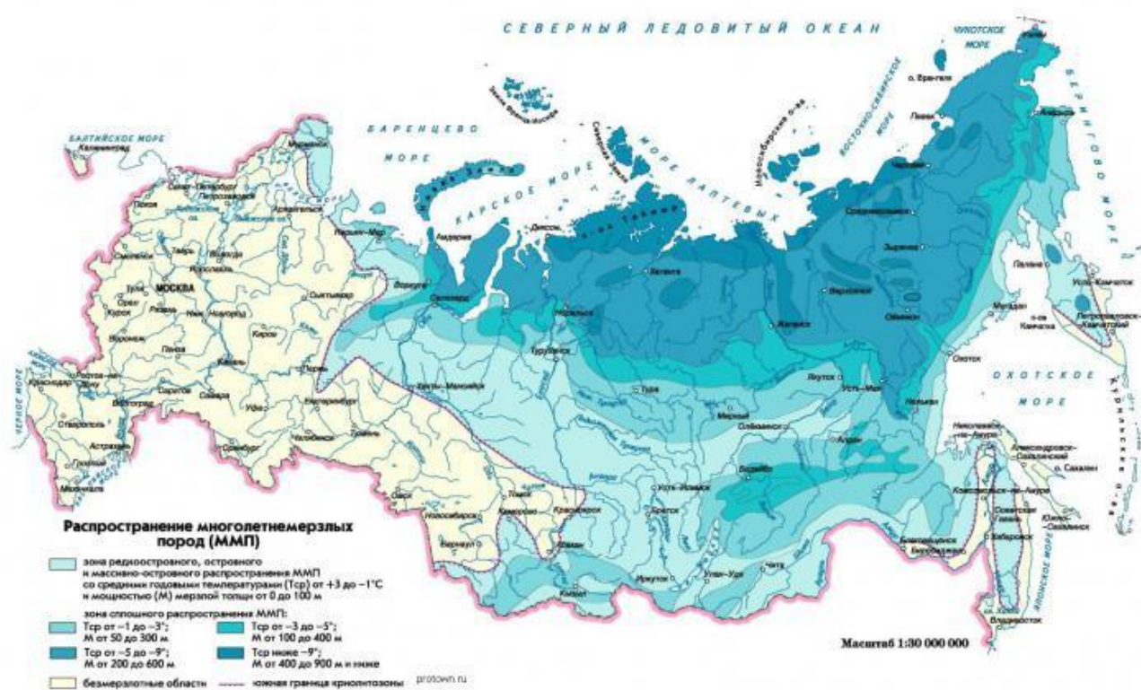
Рис.1. Территории с вечномерзлотными грунтами на карте РФ

Одной из особенностей нашей страны является расположение практически 65% ее территории в зоне вечной мерзлоты, рисунок 1 [7].