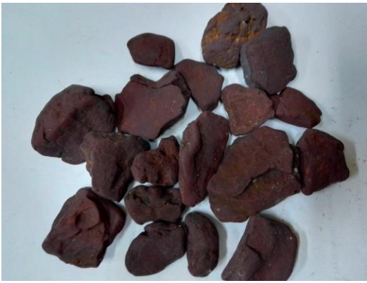
4. Пиритные огарки