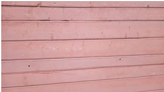
5,6. Образец краски дома

Александр Анатольевич рассказал, что его дачный дом покрашен суриком с химического завода (порошок развели олифой) и получили стойкую красивую краску. Год покраски дома 1967 [4,5].