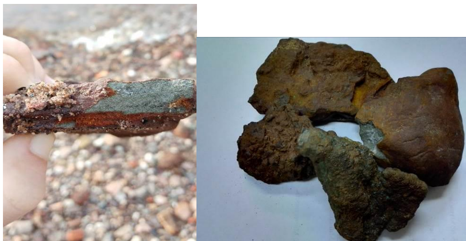
Фото автора 2,3. Образцы серного колчедана с берега Волги

При изучении материалов по химическому заводу было выяснено, что продукция имела широкий ассортимент. Это были азотная и серная кислота, купорос, соли, минеральные краски: железный сурик, мумия (красная и фиолетовая), охра разных оттенков, умбра и другие, из которых готовили квасцы железного и медного купороса. Все это производилось из серного колчедана в основном местного материала, который был оставлен когда – то на Русской равнине ледником [фото 2,3].